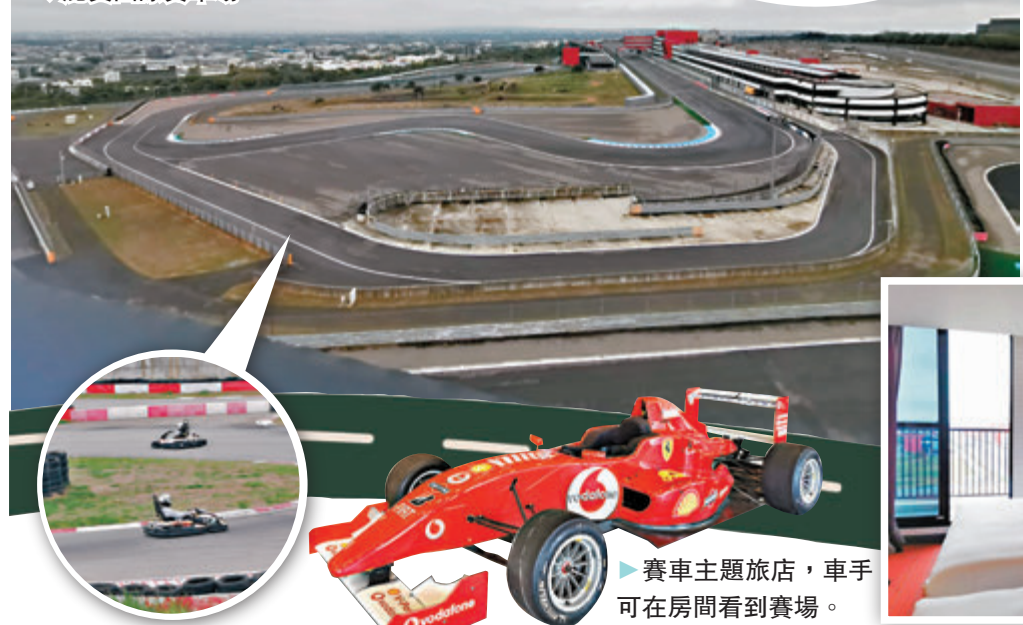
◆賽車主題旅店，車手可在房間看到賽場。