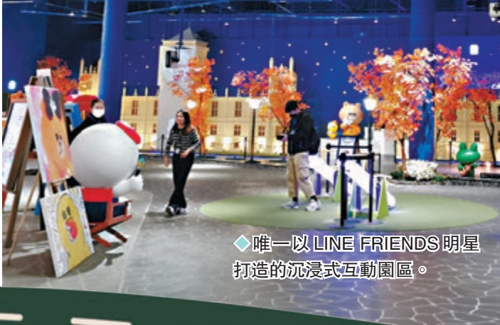
◆唯一以LINE FRIENDS明星打造的沉浸式互動園區。

佔地200公頃的「麗寶樂園度假區」集水陸樂園、飯店、Outlet、賽車、美食等項目，今年更與超人氣明星LINE FRIENDS合作，推出主題互動樂園、飯店主題房、摩天輪造型車廂等。大家只要搭飛機兩小時就能抵台，相當適合香港、澳門旅客安排三天兩夜或四天三夜旅行，度假區交通便捷，不論是高鐵、台鐵、朝馬轉運站都有規劃免費接駁車，能輕鬆開啟你的度假之旅。