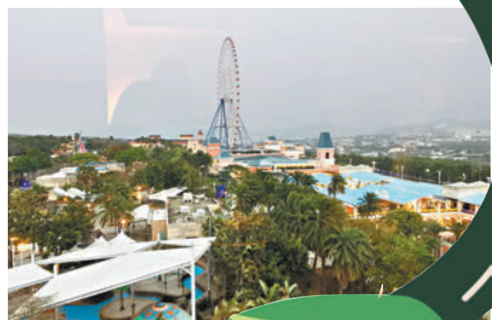
◆房間看到探索世界

坐落度假區內，福容大飯店麗寶樂園店設有休閒娛樂設施，提供中、西、日式餐飲服務，走出飯店就是雙樂園及Outlet的地方。今年，大家還可選擇住宿於LINE FRIENDS主題房，位於6樓全層，一出電梯就被LINE FRIENDS包圍，共有八個房間主題，包括閃亮星空、美味魔法師、航海冒險、童話森林、糖果樂園、浪漫滿屋、愛的連線、宅宅放假中的設計，房間中的日用品如馬克杯、熱水壺、拖鞋等充滿熊大、兔兔、莎莉等影子，同時窗邊還有一個小型帳篷，讓小朋友可以在帳篷內遊玩。