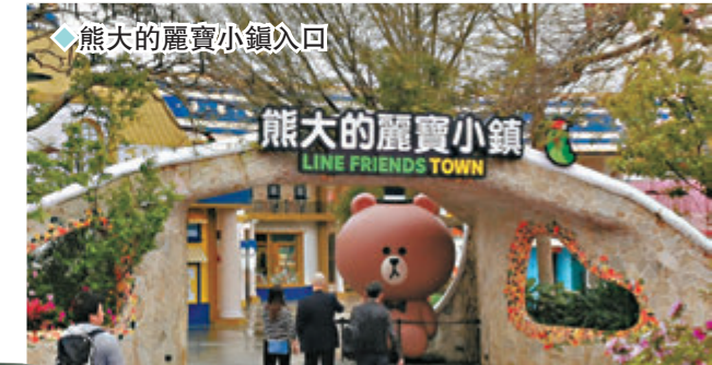
◆熊大的麗寶小鎮入口

而且，更讓人瘋狂的還有令人捨不得吃掉熊大、兔兔的美味Food Court美食區，以及荷包君絕對會哭哭失守不保的PLAY LINE FRIENDS官方商店，粉絲們必定買得滿滿。