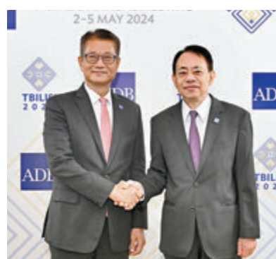
◆陳茂波（左）與亞洲開發銀行行長淺川雅嗣（右）會面。

香港文匯報訊（記者 蔡競文）財政司司長陳茂波出席由5月2日至5日舉行的亞洲開發銀行（亞開行）第五十七屆理事會年會。陳茂波早前抵達格魯吉亞時先與亞開行行長淺川雅嗣會面。雙方就區域綠色轉型、氣候融資、基建項目建設，以及加強中國香港與亞開行之間的合作等議題，交換意見。陳茂波同時出席亞開行年會的組別會議，並會與其高層管理人員，以及其他國家和地區的財金官員會面。