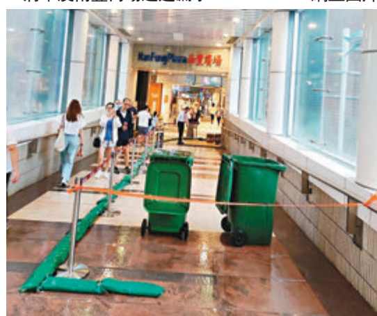
◆將軍澳南豐商場通道漏水。網上圖片