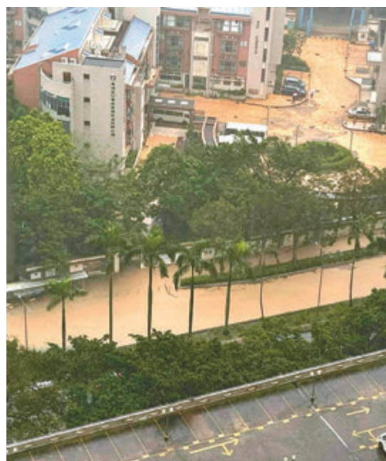
◆寶琳北路賽馬會診所附近「河流」。網上圖片