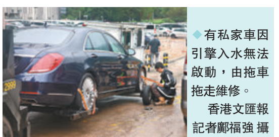
◆有私家車因引擎入水無法啟動，由拖車拖走維修。