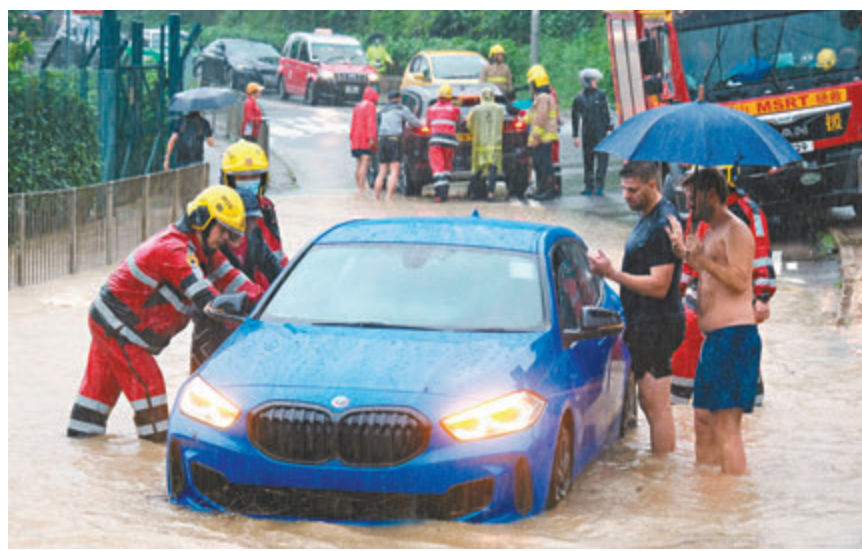
◆西貢大網仔路水浸，消防與街坊合力推開死火汽車。

至於只購買第三者保險的車主，由於只保障第三者財物，或人命受傷的意外，無法獲得賠償。沒購買全保的車主，只可以嘗試循民事方式向停車場管理公司追討，但情況比較複雜，車主需要證明停車場管理公司有失責之處，才有機會獲得賠償。