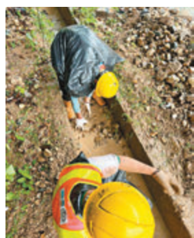
◆渠務工人在寶琳北路清理泥石。網上圖片