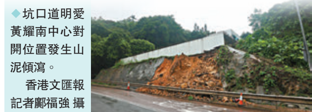
◆坑口道明愛黃耀南中心對開位置發生山泥傾瀉。

天文台初步分析結果顯示，4月中下旬華南地區持續不穩定天氣，相信是由於中低緯度西風帶中的大氣長波接近停滯，導致當中的「槽」及「脊」在過去兩周持續影響特定區域。受到「停滯」的西風槽影響，華南地區持續出現大雨及強對流等天氣，廣東省及香港所在的位置，正正在西風槽的前方。在全球暖化背景下，氣溫上升會增加大氣中可容納的水汽及加劇水循環，強降雨發生的機會亦因而增加。