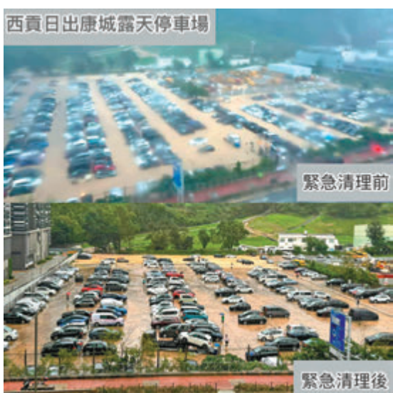
◆特區政府跨部門出動，處理各區水浸情況，如圖所示多區積水均獲緊急清理。