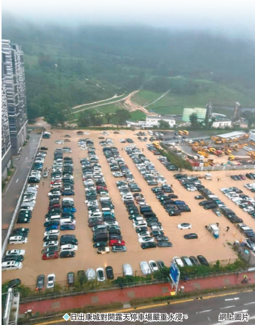
◆日出康城對開露天停車場嚴重水浸。