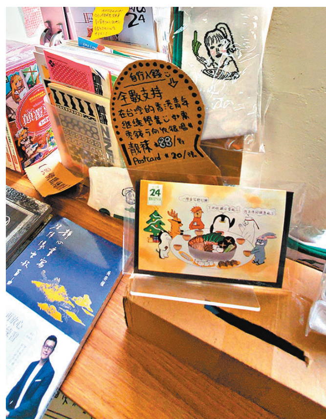
◆店內擺放捐款箱，呼籲黃絲協助台灣「手足」。

2022年「一拳書館」在疫情依舊盛行的社會環境下，罔顧市民的安危，舉辦「清酒共飲，太宰治共讀」活動，雖列明為私人活動，但須繳納入場費。警方事先收到投訴，並派兩名警員喬裝顧客交付共700元參與活動。8月26日警員到場發現，店內沒有「安心出行」的相關海報，亦沒有職員要求二人掃描相關QR Code。活動由龐一鳴致辭，隨後有職員將3支清酒倒入12個杯內提