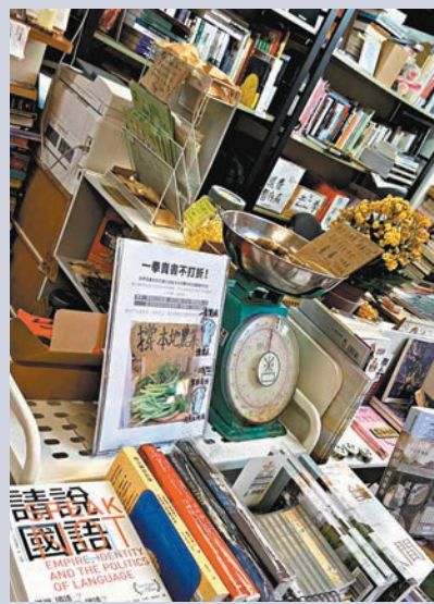
◆「一拳書館」送農作物招攬客戶。