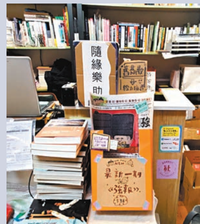
◆書館內擺放了捐款箱。