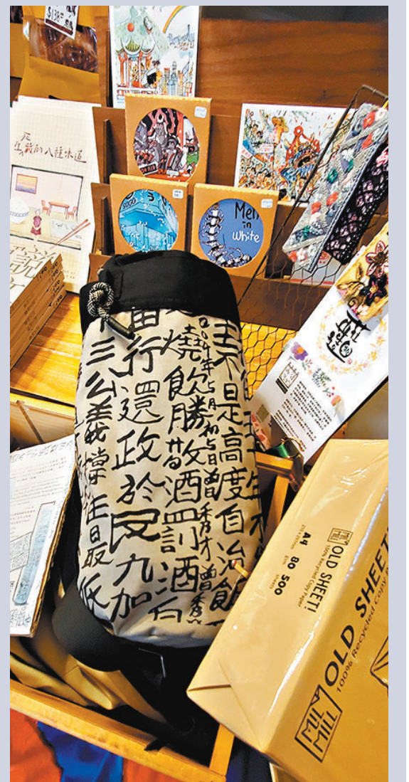
◆館內隨處可見一些具暗示性的文宣製品。

近日，「一拳書館」社交平台聲稱原計劃在一間中學舉辦以推理小說為主題的小型書展，惟活動被市民投訴而取消。之後，書店方面則倒打一耙，反指事件是「對人不對事」，暗示是受校方及政府的不公平對待，企圖挑起市民的反政府情緒；而部分黃媒及海外黃絲KOL也藉機大肆炒作，宣稱獨立書店被政府「打壓」。