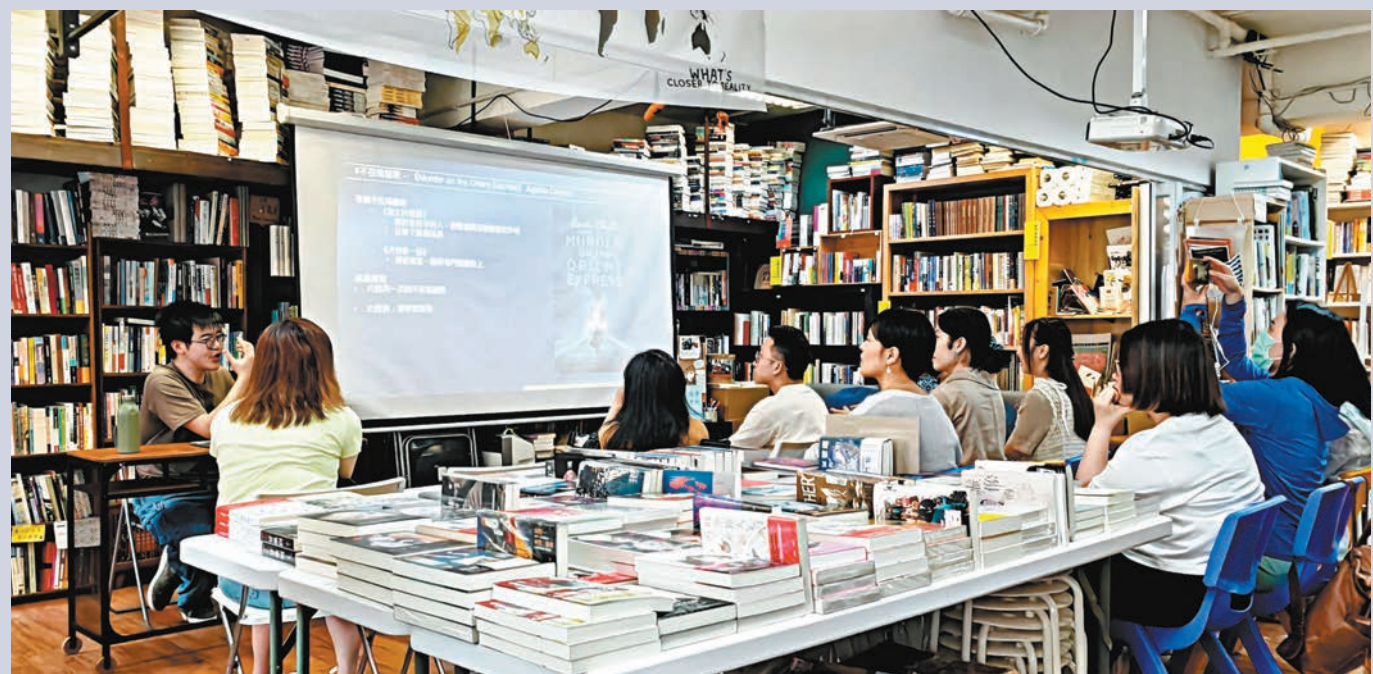
◆書館內經常舉行所謂「讀書會」、推介會等。