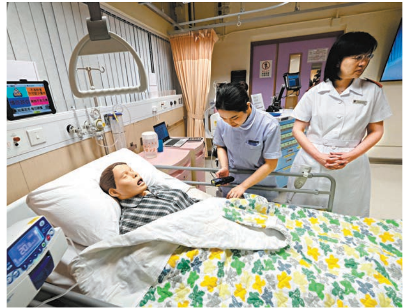
◆學員在護士學校內模擬臨床實習。

醫管局多年來一直提供為期3年的護理學高級文憑課程，目前有明愛醫院、伊利沙伯醫院及屯門醫院3間普通科護士學校，完成後即合資格註冊為普通科註冊護士，其後更可持續進修以獲得護理學相關學士學位。為進一步提升護理教學質素，令護士學生達到高水平的分析和自我增強技能，醫管局由2021年學年起，將課程提升至4年全日制的護理學專業文憑，每年每所護士學校各招募100名學生。醫管局計劃由今年的新學年起將課程改為3.5年，令學員透過更好的課堂與臨床實習的銜接，提升教學質素。