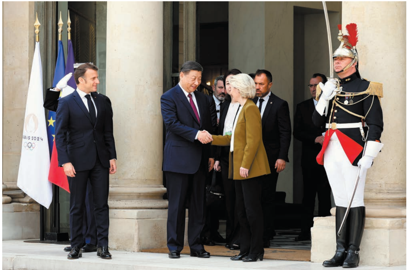
◆當地時間5月6日，中國國家主席習近平在巴黎愛麗舍宮同法國總統馬克龍、歐盟委員會主席馮德萊恩舉行中法歐領導人三方會晤。