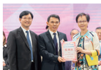
◆廣東省教育廳一級巡視員朱超華接受感謝狀。