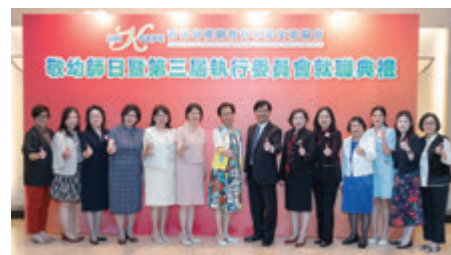
◆香港幼稚園教育專業交流協會第三屆執行委員會就職典禮。