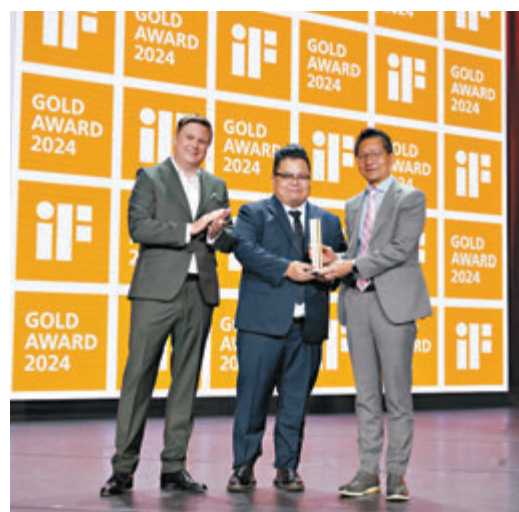
◆「嶺大創業行動」設計團隊所設計的PureAura袖珍空氣淨化機，榮獲2024年度iF設計獎金獎。嶺大供圖