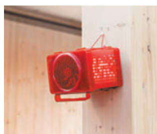
◆PureAura設計可掛牆使用。

嶺大校長及韋基球數據科學講座教授秦潤鈞指，是次獲獎肯定了嶺大在創新及科技領域上的多元性，在人道主義發明領域上作貢獻，更展現了官、商、民、學所凝聚的力量，令人鼓舞，「我期待嶺南人在以人為本的創新及知識創造方面再創佳績，在世界舞台上綻放光芒。」