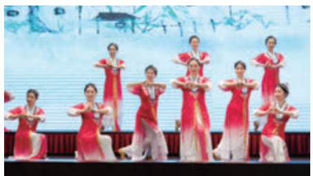
◆汕頭市到賀，表演潮韻操。