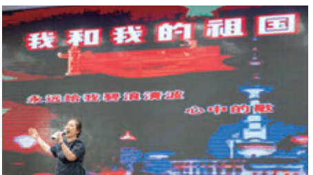
◆珠海市到賀，高歌「我和我的祖國」。