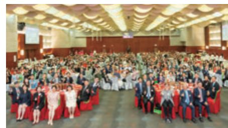
◆「敬幼師日暨第三屆執行委員會就職典禮」圓滿舉行，場面鼎盛。