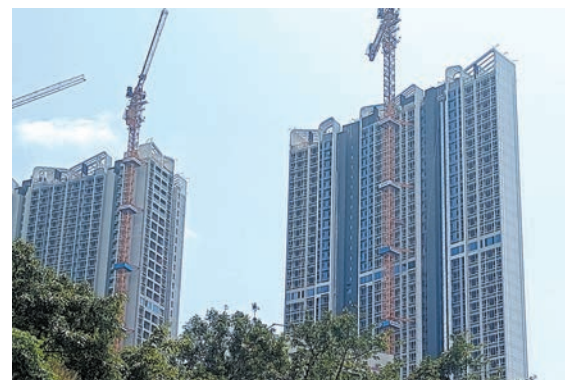
◆深圳推出分區放寬樓市限購政策。資料圖片

對於有兩個及以上未成年子女的深圳市戶籍居民家庭，在執行現有住房限購政策的基礎上，允許他們在上述指定區域內再購買1套住房。這一政策調整旨在滿足多子女家庭對更大居住空間的需求，同時也體現了對家庭結構的關注和支持。