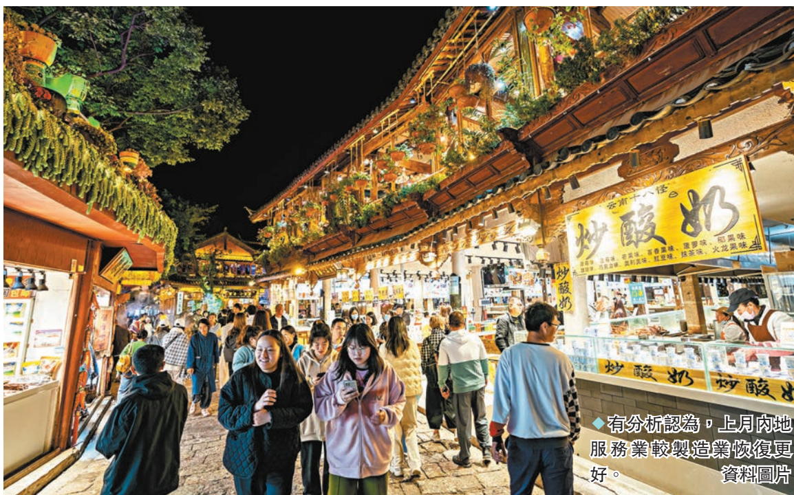
◆有分析認為，上月內地服務業較製造業恢復更好。資料圖片

從財新中國服務業PMI分項指數看，服務業供求同步擴張，價格穩中有升，其中新訂單指數、新出口訂單指數均在擴張區間升至2023年6月和7月以來最高。