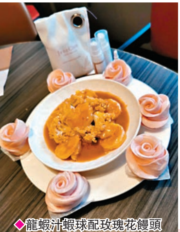
◆龍蝦汁蝦球配玫瑰花饅頭