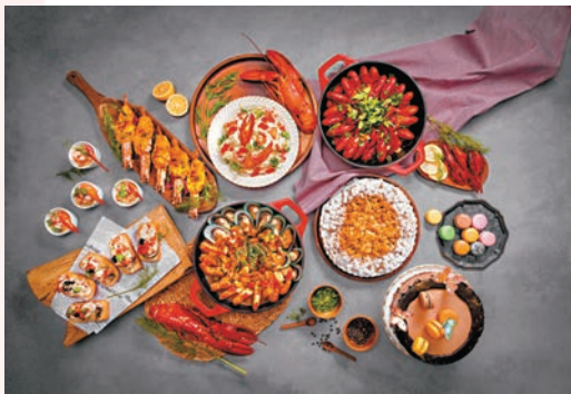
▲龍蝦大蝦自助晚餐

位於馬可孛羅酒店的 Three on Canton，今個月推出全新龍蝦大蝦自助晚餐，以時令龍蝦及大蝦入饌，炮製多款「蝦」之佳餚。為慶祝母親節，五月期間，逢周五、六和日享用自助晚餐，每位母親可獲贈冰鎮柚子鮑魚乙客。餐廳還推出訂座優惠，四至七位訂座可享全單七折優惠；八位或以上更可享全單六折；網上商店亦設有早鳥優惠，凡於2024年5月8日或之前預訂5月11至12日的母親節自助晚餐，優惠低至六折。