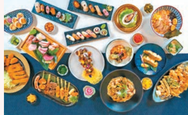
▲日式主題午市及晚市自助餐

熱愛鹹甜茶點的媽媽們，可選位於香港維港凱悅尚萃酒店的 The Farmhouse 咖啡廳，與美國純淨護膚品牌 FARMACY Beauty 合作推出的全新下午茶，每份下午茶套餐另可獲贈 FARMACY Beauty 「Bee Your Skin! 蜂蜜基礎護膚套裝」，或另可選購 The Farmhouse Deli 餅店期間限定的「檸檬接骨木花戚風蛋糕」，其收益扣除成本後，將捐贈予本地慈善機構「母親的抉擇」，以協助弱勢少女及兒童面對困境。同時，於母親節周末期間，與母親到訪 The Farmhouse 咖啡廳享用日式主題午市及晚市自助餐，或到頂樓 Cruise 空中餐廳及酒吧細味現代亞洲美饌，所有母親即時可獲贈韓國「The history of Whoo 后」的宮廷護膚禮品套裝。