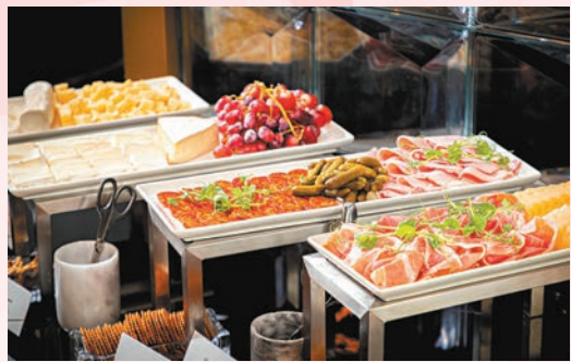
▲母親節超級早午餐

大家可選擇在香港美利酒店 The Tai Pan 享用超級早午餐，並讓小冒險家們探索一系列的趣味活動，享用豐盛的自助餐，包括新鮮的冰鎮海鮮、烤牛肋排和威靈頓三文魚，更有多款主菜供選擇，如香烤鱸魚、炭燒和牛西冷牛排和多種亞洲美食、兒童精選菜式以及精緻甜點。