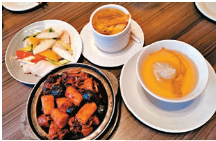
◆「春日養生·養肌」菜式