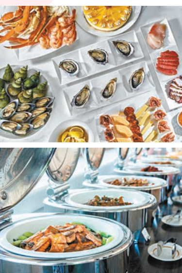
▲Garden Lounge 母親節半自助海鮮晚餐

相約摯愛母親於香港美利酒店的 Garden Lounge 共享海鮮半自助晚餐，品嘗多款不同輪換冰鎮海鮮、新鮮大啡蟹及蟹場蟹腳，精緻冷盤、多款沙律及芝士，自助區更備有多款惹味熱葷，大家亦可根據自己喜好選擇主菜，菜式包括烤西冷牛扒及烤波士頓龍蝦，並以一系列精緻的甜點及手工意大利雪糕畫下句點。在此特別日子，每位母親更將免費享用冬菇花膠燴鮑魚及椰子海螺燉雞湯，滋潤補身，同時每位惠顧的母親也會獲贈 Wellness at The Murray 獨家優惠券。