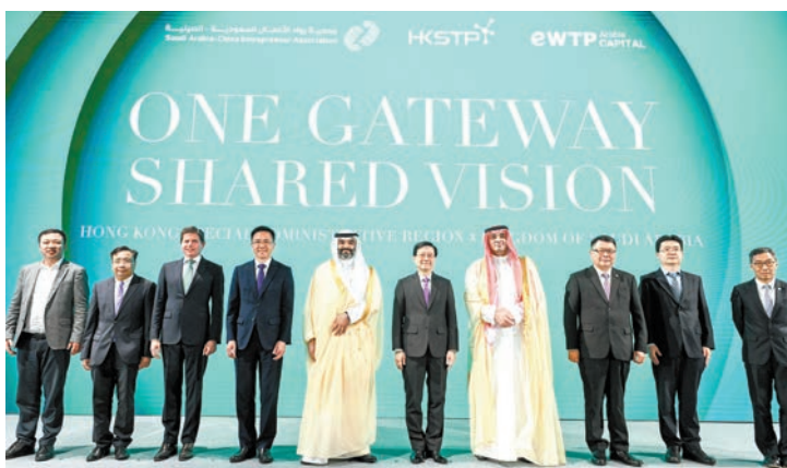
◆港府與中東近年合作頻繁，圖為去年中舉辦的One Gateway Shared Vision晚宴。