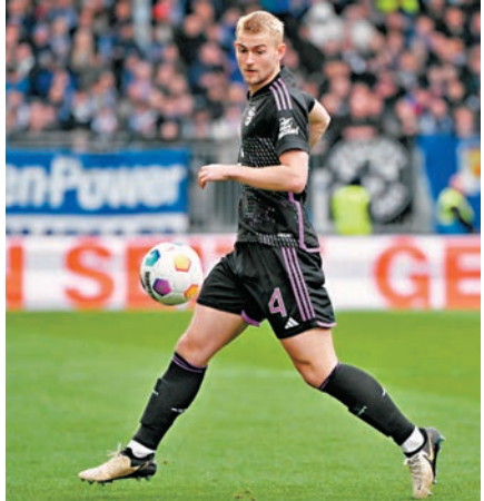
▲迪歷特是有機會代替金玟哉扼守拜仁中路。資料圖片

首回合比賽後的另一焦點,是拜仁的韓國國腳守將金玟哉明顯未能應付大賽壓力,首回合他先是大意失位,被皇馬翼鋒雲尼斯奧斯單刀射入先開紀錄;之後他又在自己禁區魯莽踢跌洛迪高斯輸12碼,完全是拜仁「由贏變和」的罪人,因此次回合比賽預計教練杜曹將不會再給予這位韓國國腳機會,其位置將被荷蘭國腳馬菲斯迪歷特取代;然而眾所周知,迪歷特和其今場拍檔艾歷迪亞,均屬於不算靈活的守將,面對善於走位和速度高的雲尼斯奧斯和洛迪高,理論上將不存在優勢。