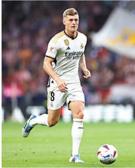
▲皇馬中場核心卻奧斯屢為隊友鋪橋搭路。

從首回合比賽所見,皇馬與拜仁的實力十分接近,皇馬在倒戈的中場卻奧斯負責組織下,常可憑一次又一次的精妙直線撕破拜仁的防線;至於拜仁的攻擊組合哈利卡尼、利萊辛尼和穆西亞拿,亦令到皇馬後防疲於奔命,其中利萊辛尼和穆西亞拿的速度和盤扭能力,可說是皇馬後防的惡夢,拜仁首回合兩個入球,便是在辛尼和穆西亞拿的個人能力協助下所取得。