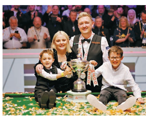
▲威爾遜與家人合影捧盃。