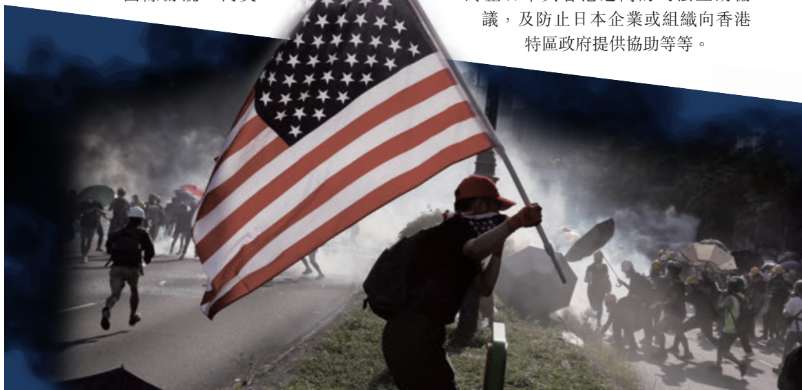
◆2019 年黑暴期間，常見有暴徒高舉美國旗衝鋒。