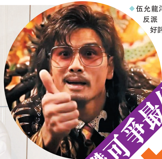
◆伍允龍浮誇式演繹大反派「王九」大獲好評。