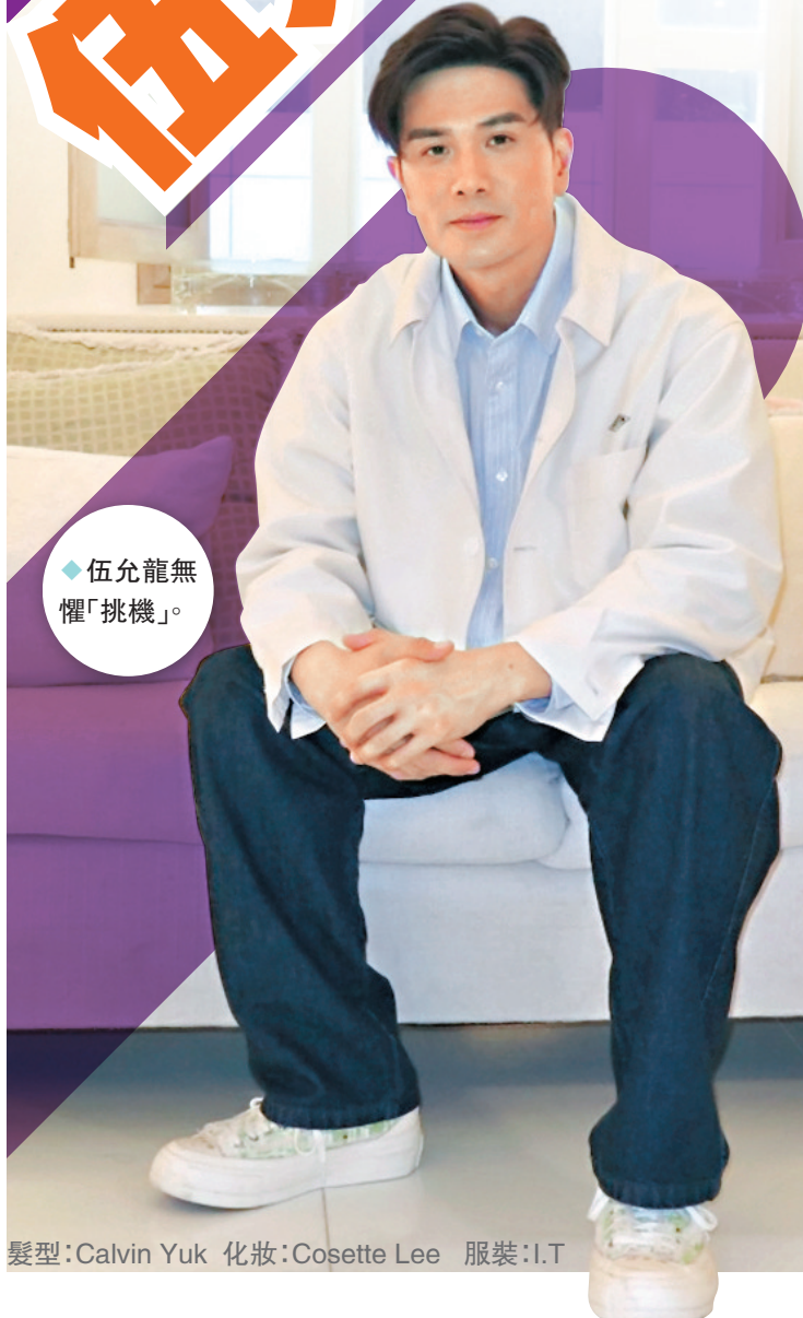
髮型: Calvin Yuk 化妝: Cosette Lee 服裝: I.T