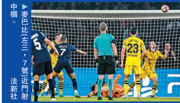
▶麥巴比(左三，7號)近門射中楣。