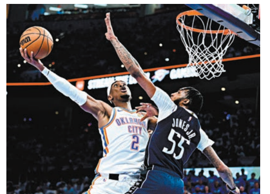
▲S·阿歷山大(左)攻入29分。