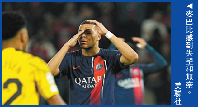
▶麥巴比感到失望和無奈。 美聯社

香港文匯報訊(記者 梁志達 綜合報導)巴黎聖日耳門(PSG)在昨日凌晨的歐洲聯賽冠軍盃(歐聯)4強次回合，雖然全場狂攻希望平反敗局，但面對多蒙特的沉穩防線，真正具威脅的機會不算太多，而4次中楣柱飲恨失機，更讓這支法甲班霸只能望門興嘆。 PSG回歸主場力求平反首回合0:1敗局，主帥安歷基輪換上卡路拉莫斯夥同麥巴比和奧士文尼迪比利兩大尖刀攻堅。雖然球隊全場有67%控球率，更瘋狂製造了31次射門，可是客隊一對中堅曉姆斯和舒洛達碧克卻沒有給對手太多真正機會，PSG的5次射門僅多客隊2次，倒是曉姆斯下半場在一次角球