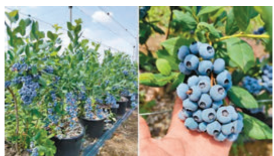
◆ 塞爾維亞藍莓產業前景看好，藍莓種植園呈爆炸式增長，是歐洲最大的藍莓生產國之一。

由於氣候條件適宜，春季沒有明顯的霜凍災害，塞爾維亞藍莓產業前景看好，藍莓種植園呈爆炸式增長，是歐洲最大的藍莓生產國之一。塞爾維亞藍莓種植除了面積不斷擴大，還引入新品種等提高藍莓質量，將最新技術融入了生產和貿易，助推藍莓產業發展，主要出口市場為荷蘭、德國、英國、波蘭和俄羅斯等歐洲市場，此外還出口馬來西亞、新加坡、中國