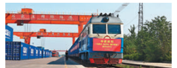
◆ 5月9日，由石家莊國際陸港發行的中歐班列（河北石家莊—匈牙利—塞爾維亞）鳴笛啟程。