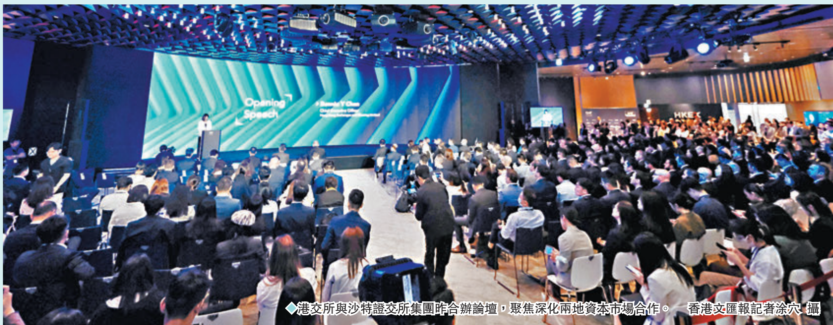
◆港交所與沙特證交所集團昨合辦論壇，聚焦深化兩地資本市場合作。

港交所與沙特證交所集團昨在港合辦首屆「香港—沙特資本市場論壇」。本次論壇以「促進交流」為題，雲集超過650名來自沙特阿拉伯、中國內地、香港及世界各地的金融界領導、監管機構、投資者及企業代表，分享在不同地區的投資機遇。與會者包括200多位來自沙特阿拉伯的代表。除了峰會論壇外，5月9至10日的企業接洽活動亦促成了300多場雙邊會議及合作機會，參與者包括200名投資者和40多家企業。