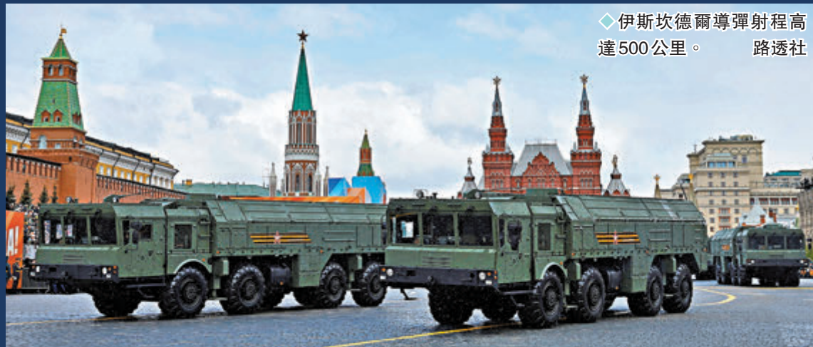
◆伊斯坎德爾導彈射程高達500公里。

香港文匯報訊 俄羅斯周四(5月9日)舉行年度勝利日閱兵，紀念衛國戰爭勝利79周年，場上展示多款軍備。總統普京(右圖)稱不容許任何人威脅俄羅斯，軍隊隨時準備作戰。