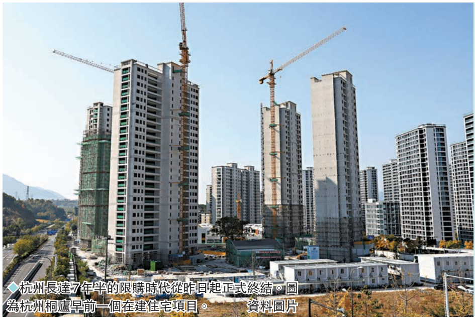
◆杭州長達7年半的限購時代從昨日起正式終結。圖為杭州桐廬早前一個在建住宅項目。資料圖片

一天之內，內地兩大熱點城市浙江省杭州、陝西省西安先後宣布全面取消樓市限購，杭州購房更可以申請落戶。至此，內地仍對住房實施限購的地方除海南省外，僅北京、上海、廣州、深圳四個一線城市，以及天津部分區域和珠海橫琴。業內專家表示，一些限購的城市將繼續優化限購政策，特別是二線城市的限購政策調整節奏或將加快，而核心城市降低首付比例、降低房貸利率、降低交易稅費等政策也存在調整預期。