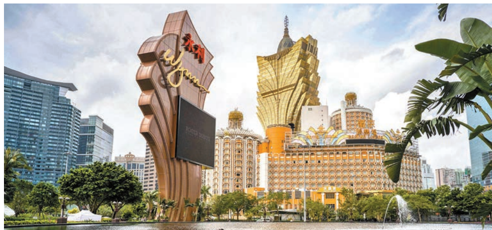
◆澳博調整後息稅折舊及攤銷前利潤8.64億元，比上年同期的3,100萬元增26.8倍。資料圖片

受惠於博彩毛收入大幅增長，博彩毛收益達18.77億元，按年升102.3%。非博彩收益亦持續穩步增長，達8,100萬元。