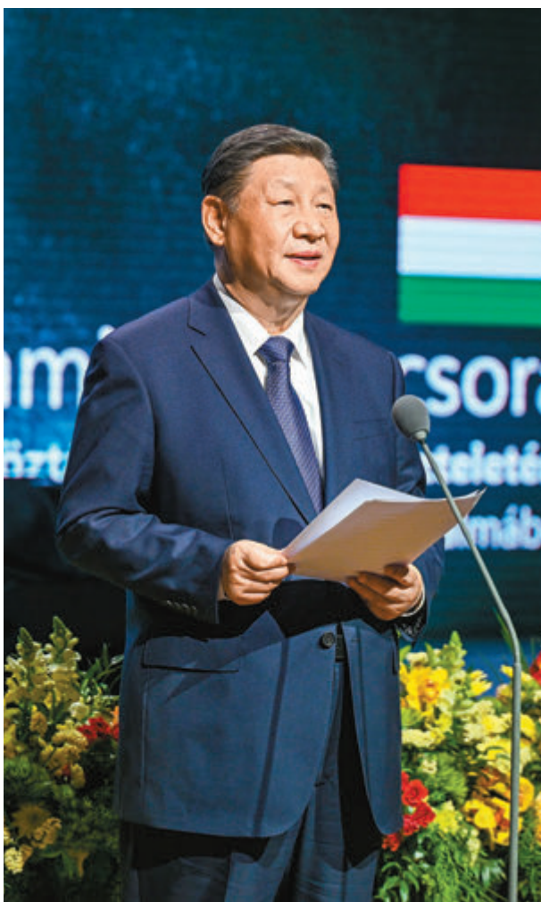
◆當地時間5月9日晚，國家主席習近平和夫人彭麗媛在布達佩斯城堡山出席匈牙利總理歐爾班和夫人雷沃伊舉行的隆重歡迎宴會。這是習近平在宴會上致辭。新華社

香港文匯報訊 據新華社報道，當地時間5月10日中午，習近平和夫人彭麗媛在布達佩斯應邀出席匈牙利總理歐爾班和夫人舉行的饒行活動。