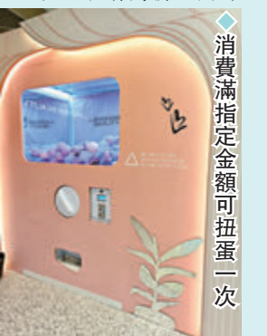
◆消費滿指定金額可扭蛋一次