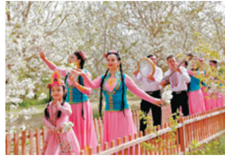
▲莎車縣米夏鎮紅櫻桃景區裏的走秀表演

在天山南麓的喀什地區莎車縣，4.5萬畝櫻桃花也迎來一年一度的賞花季。在該縣的米夏鎮紅櫻桃景區，白裏透紅的櫻桃花在枝頭搖曳生姿，遊客們或在花間小徑悠然漫步，或在櫻桃樹下駐足流連，盡情享受這難得的春日美景。