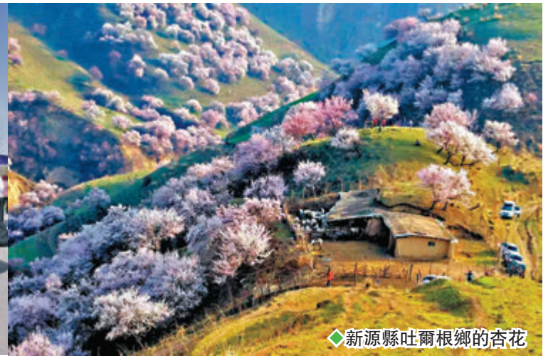
◆新源縣吐爾根鄉的杏花