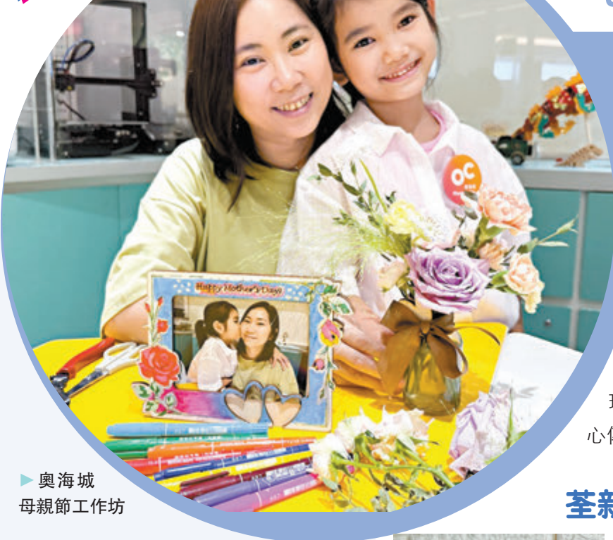
▶奧海城 母親節工作坊