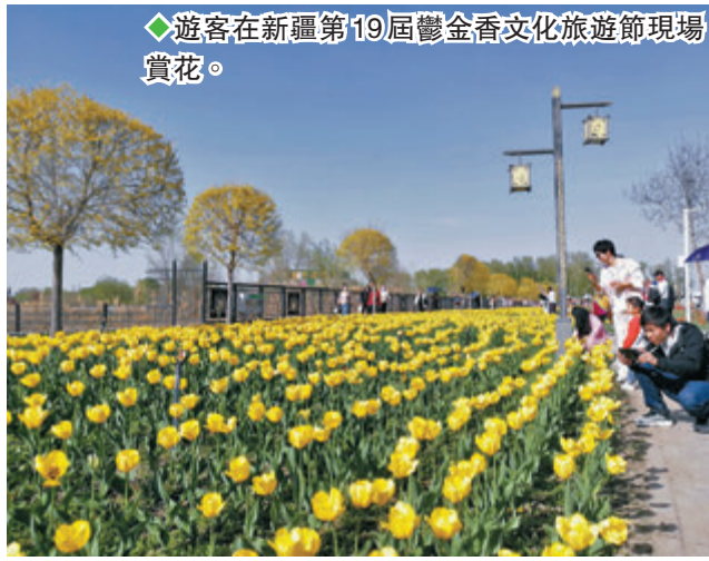
◆遊客在新疆第19屆鬱金香文化旅游節現場賞花。