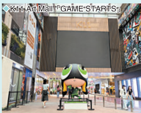
◆K11 Art Mall「GAME STARTS」