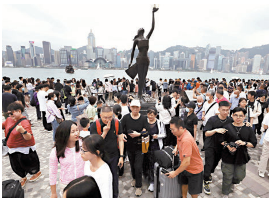
◆陳茂波昨日表示，特區政府和市民都衷心感謝中央政府對香港的支持愛護。圖為五一黃金周內地遊客擠滿香港尖沙咀星光大道。

有內地網民認為增加個人遊城市意義非凡，希望內地與香港可以民意互通，進一步建設美好家園；有網民也指這是一項積極政策，有助加強內陸與港澳地區交流合作。有網民則建言進一步簡化內地赴港手續，讓更多內地明星、藝術家到香港演出，表示可吸引「粉絲」帶動經濟，並要多宣傳香港的健康消費，以及制定香港影視旅遊地標和路線，而當務之急則是提升服務品質和服務意識。不少網民也期望香港提升對旅客的服務質素。