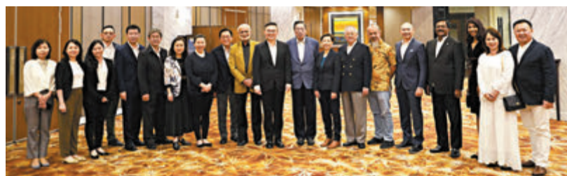
◆香港立法會考察團昨日抵達吉隆坡訪問，昨晚考察團一行與香港馬來亞總商會代表餐敘交流。圖為考察團與該總商會代表合照。

香港文匯報訊 立法會主席梁君彥率領香港立法會考察團昨日啟程前往東盟三國訪問，5月12日至18日期間將先後到訪馬來西亞、印尼及新加坡，這也是今屆立法會首次海外職務考察活動。