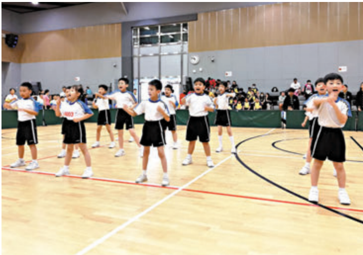
◆奪得小學組一等獎的靑色園主辦可銘學校,學生們在比賽時展現武藝操。