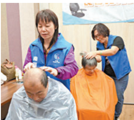
◆南區關愛隊舉辦長者義剪日,為有需要的長者理髮。

南區關愛隊於2023年4月30日率先起動,轉眼一年過去,我們一直透過主動接觸和廣泛宣傳,與居民建立緊密的聯繫網絡,挨門送暖,遇事施援,讓關愛傳遍南區。