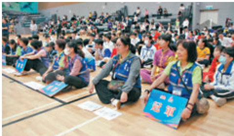
◆「感恩盃」校際武藝操大賽吸引逾700名中小學生參加。