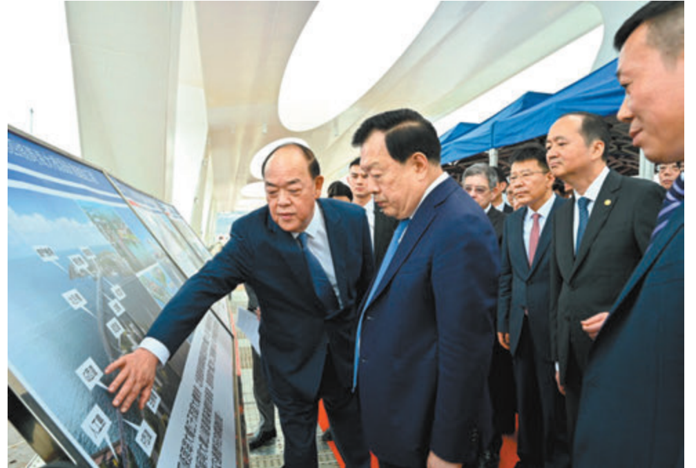
◆ 夏寶龍考察澳門大橋建設工地。