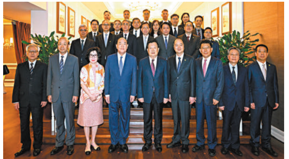
◆ 夏寶龍與澳門行政長官及行政、立法、司法機構主要負責人交流。