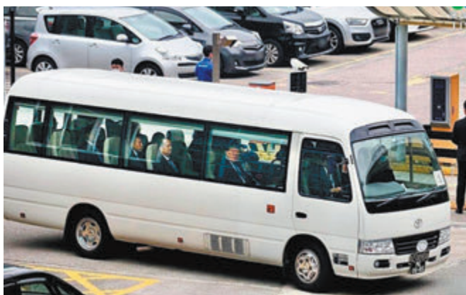
◆ 夏寶龍昨日抵達澳門展開7天考察行程。圖為夏寶龍一行乘專車離開機場。