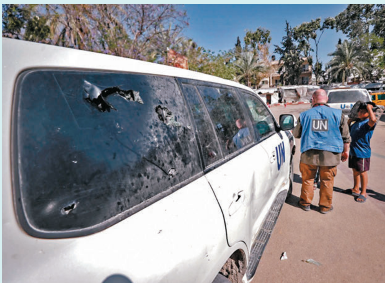
◆遇襲聯合國車輛滿布彈痕。

香港文匯報訊 據聯合國官網消息，一輛載有聯合國工作人員、有明顯標識的車輛，周一(5月13日)在前往加沙南部拉法的一家醫院時受到以色列軍隊襲擊，導致一名外籍工作人員死亡、一人受傷，是本輪巴以衝突以來，首名聯合國外籍人員死亡事件，聯合國秘書長古特雷斯呼籲對此事進行全面調查。據「人權監察組織」統計，以軍在加沙行動期間，8次襲擊國際人道主義組織的車隊和設施，共造成31人傷亡，行為令人髮指。