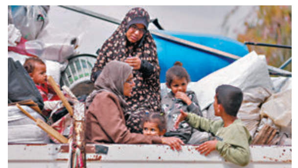
◆加沙截至去年底有170萬名巴人在境內流離失所。

IDMC表示，蘇丹是自2008年有紀錄以來境內流離失所者人數最多的單一國家，有910萬人，幾乎一半的境內流離失所者生活在撒哈拉沙漠以南非洲。去年因衝突導致新的人口移動情況中，蘇丹、剛果民主共和國和巴勒斯坦的衝突佔了將近三分之二。加沙截至去年底有170萬名巴勒斯坦人在境內流離失所。