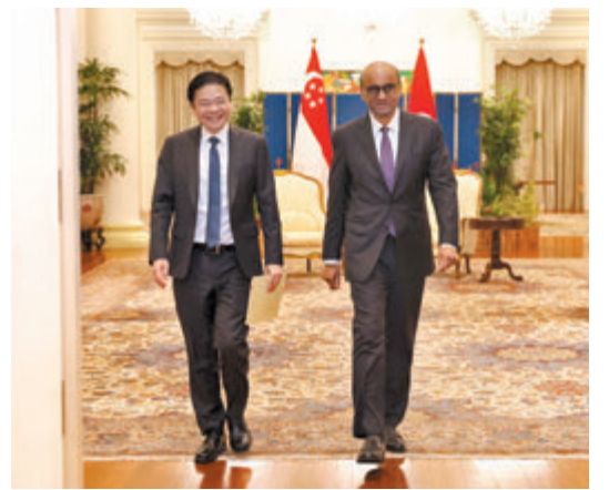
◆黃循財(左)與總統尚達曼。

黃循財談到他決定擔任新加坡第四任總理時，考慮到他未來將面對更大責任，以及他是否準備好承擔這些責任，因這與他2011年決定從政時截然不同，「這不僅是一個集選區的問題，而是談論國家責任，帶領執政黨參加大選，這是一個更大的角色。」