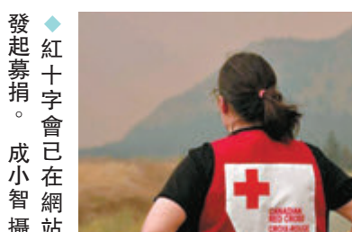
◆加拿大卑詩省發出指引，教導民眾如何應對山火。