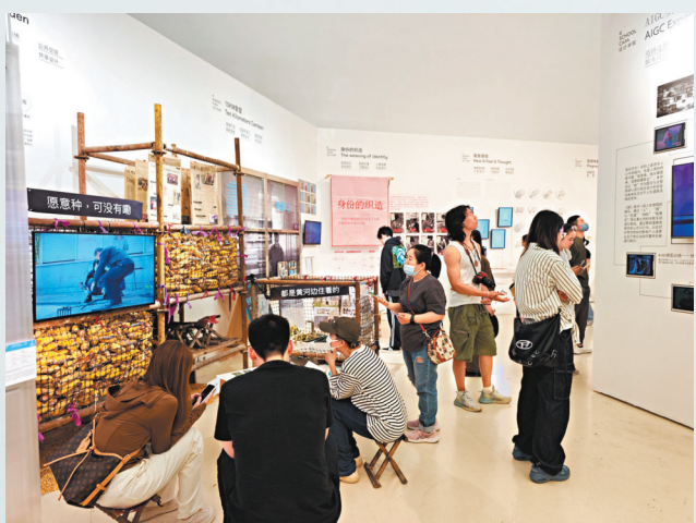
▲觀眾在中央美術學院美術館參觀央美設計學院研究生畢業作品。

構建中國青年策展人培養體系，尤其是院校畢業以後，在成為機構策展人或獨立策展人的道路上，還可以為他們創造更多機會。今天很多青年策展人沒有將策展視為可以謀生的職業，而是更多視策展為副業，大多都是有重多身份的年輕學者。在成為合格、優秀的策展人的路途中，既需要個人自覺性的探索和長期堅守，也需要外部建立長期有效的激勵機制。為此，他提出，相關部門要構建身份認同，為策展人與藝術機構之間搭建溝通平台，並注重項目運作和資金籌措能力的培養。