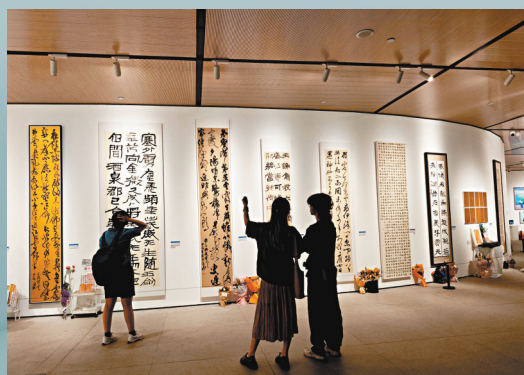
▲觀眾在中央美術學院美術館參觀央美書法學院研究生畢業作品。