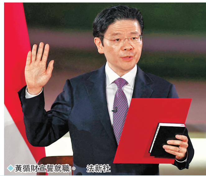
◆黃循財宣誓就職。

李強致電祝賀黃循財就任新加坡總理。李強表示，中國和新加坡是友好鄰邦和重要合作夥伴。建交30多年來，兩國政治互信不斷深化，各領域合作成果豐碩，不僅為各自發展提供助力，也為地區國家合作樹立了標杆。去年，兩國確立了全方位高質量的前瞻性夥伴關係，為新時期中新關係明確了戰略方向。中方高度重視中新關係發展，我願同黃循財總理保持密切溝通配合，推進雙方高質量合作，鞏固中新傳統友好，為兩國人民帶來更多福祉，為地區和平穩定與繁榮作出更大貢獻。