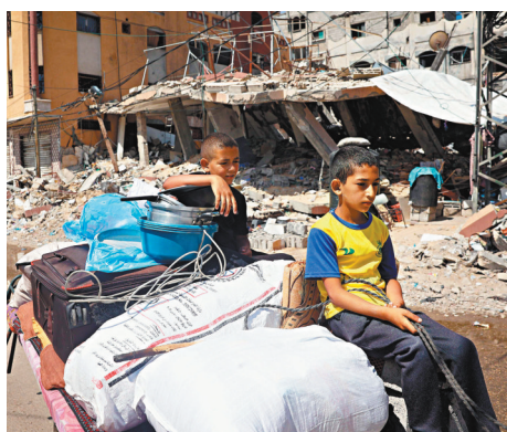
◆以軍隨時全面進攻拉法，當地民眾陸續撤離。

香港文匯報訊 美國官方消息人士透露，美國國務院已將向以色列提供價值10億美元(約78億港元)的武器援助計劃，納入國會審查程序。官員指出，最新一批武器包括坦克炮彈、迫擊炮和裝甲戰術車，這批武器是來自國會上月通過支持烏克蘭和以色列等防禦的950億美元(約7,429億港元)打包法案。