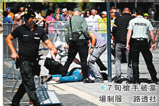
◆7旬槍手被當場制服。

方向黨勝出大選，第3度出任總理，領導民粹主義政府。他在競選期間採取親俄立場，並發表反美言論。批評者憂慮斯洛伐克將放棄原本的親西方路線，反對派曾多次在全國各地舉行集會，抗議菲佐的政策。