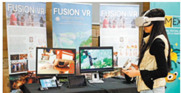
◆互動媒體系與英國Teesside University合作計劃，兩地學生共同製作VR遊戲Fusion VR，作品在英國一國際展覽中展出。