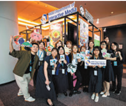
◆角色設計(Character Design)班的學生參加國際授權展。