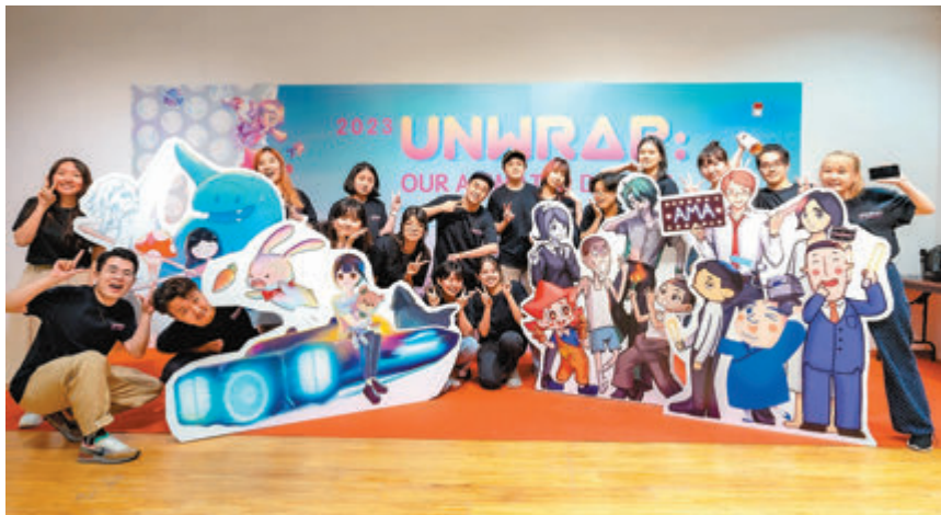
◆學生籌辦畢業作品展，展示學習成果。