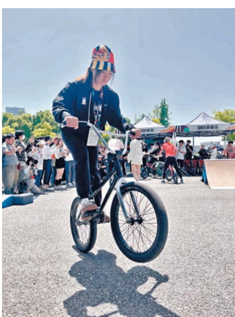
▲鍾天使體驗小輪車。

香港文匯報訊(記者 夏微 上海報道)16日，「奧運會資格系列賽·上海」開賽。作為一場「更年輕、更城市、更開放」的賽事，不僅是專業選手的競技舞台，也是廣大體育愛好者的節日。當天上午，范志毅、吳敏霞、鍾天使、趙麗娜、黃齡等上海文體明星們來到現場，融入城市體育節的熱鬧氛圍中，體驗滑板、小輪車、攀岩等奧運項目的魅力。