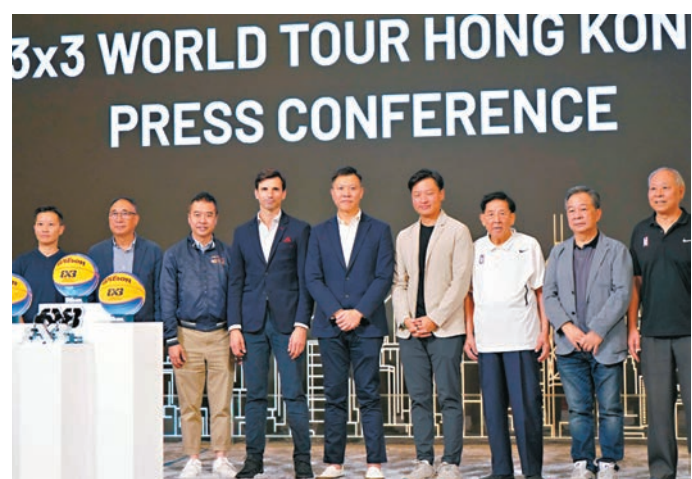
▲FIBA 3×3賽會昨宣布香港將於今年11月首度主辦年終賽。

香港過往三年舉辦三人籃球賽事大獲好評，繼舉辦了FIBA3×3大師賽及巴黎奧運資格賽後，主辦方M1 Group Limited宣布今年賽事規模得到進一步提升，將於今年11月23至24日主辦最高級別的FIBA3×3年終賽，屆時12支標註着世界三人籃球最高水平的隊伍將會雲集香港角逐冠軍寶座。在世巡賽總共16站賽事