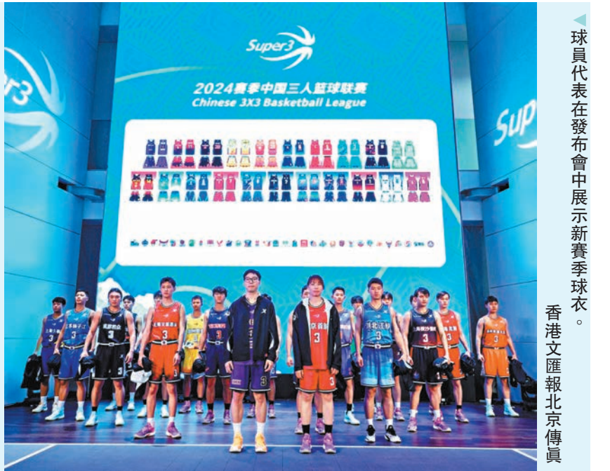
球員代表在發布會中展示新賽季球衣。

本賽季超三聯賽常規賽將啟用大區賽+爭霸賽兩種賽制。全國共設置德清、深圳、貴陽、無錫、成都、靖江六大賽區和寧波、北京、張家港、重慶四站爭霸賽。5月24日起至11月10日，19支超三聯賽俱樂部將在長達5個月的賽期內歷經常規賽、季後賽和總決賽，決出最終冠軍。值得一提的是，爭霸賽冠軍可以獲得FIBA挑戰賽和大師賽外卡名額。此外，新賽季中國女子三人籃球聯賽球隊擴充至15支，為聯賽增添了新鮮血液。