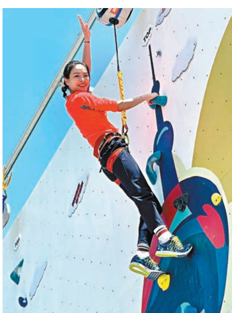
▲跳水名宿吳敏霞體驗攀岩。