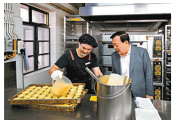
◆夏寶龍到訪路環一家深受旅客歡迎的蛋撻店。

澳門特區政府文化局局長梁惠敏受訪表示，夏寶龍主任認為有關文遺片區非常值得保留、弘揚。事實上，文化遺產、建築遺產和非遺等均是城市重要資源，是城市可持續發展的重要內涵，期望更好運用和轉化澳門深厚中西文化資源，助力「1+4」經濟適度多元，並利用文化，擦亮本澳國際大都市「金名片」。