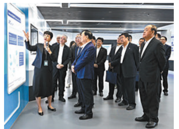
▲夏寶龍考察澳門科技大學。