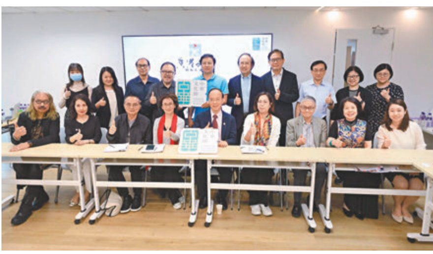
◆香港文聯介紹八大文藝活動詳情。

示，國家的「十四五」規劃明確提出支持香港發展中外文化藝術交流中心，他指，香港文聯未來的工作重點是在香港普及和傳承中華文化，弘揚愛國主義精神，思考怎樣與內地進行更多交流與合作，以及思考怎樣藉助香港文聯的人才資源優勢配合發展創意文化產業，將之打造成為香港經濟的支柱。他相信，「中華文化節」只是一個開始，香港以後每年都會做得更好、更豐富。