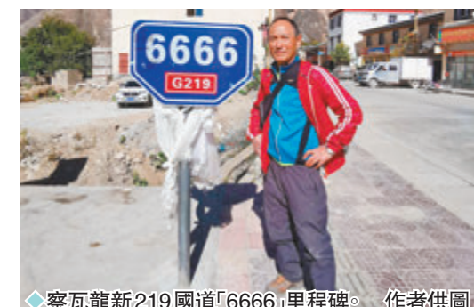
◆察瓦龍新219國道「6666」里程碑。

隨着國家西部大開發的進展，西藏同周邊和內地的交通越來越方便順暢。很多過去難以翻越的山口，已經通了隧道，過去的天塹已經變成通途。自駕進藏遊很快成為熱門，現有的八大人藏線路中有6條成為大熱：穿越兩大無人區的109青藏線；號稱「世界屋脊中屋脊」的219新藏線；人稱「此生必駕」的318川藏南線；「人文景觀大道」317川藏北線；「風花雪月」滇藏線，和經過察瓦龍進藏的丙察察線。丙察察線是指從雲南怒江傈僳族自治州貢山獨龍族怒族自治縣的丙中洛鎮，經西藏芒市察隅縣的察瓦龍鄉，到察隅縣城的公路。丙察察線雖然是距離拉薩最近的進藏公路，但也曾經是最爛又險的公路。這條在滇藏交界的怒江大峽谷中行駛的路線上，不僅曾經幾乎是全程「炮彈坑」「搓衣板」路面，而且路邊山崖上時常有泥石流和落石傾瀉下來，加上異常乾熱，越野難度很大，只適合純粹的越野玩家。因此一度是專業越野玩家的自駕之路。近幾年西藏自駕遊越來越火爆，驢友們對其他進藏線上的風景審美已經疲勞，迫切想領略丙察察線上的風景審美已經疲勞，迫切想領略丙察察線上的爛路也逐漸被柏油路替代，路上的自駕遊