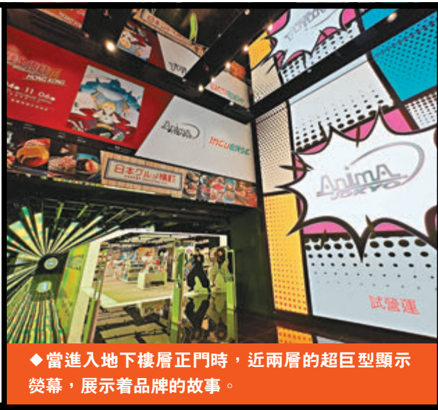
◆當進入地下樓層正門時，近兩層的超巨型顯示熒幕，展示着品牌的故事。

正當不少店舖相繼結業、大家覺得香港百業蕭條之際，也有不少「過江龍」來港開設新店，甚至設立其海外首間旗艦店，為香港旅遊購物及美食店舖注入新元素，現在就為大家走入新店中，探討箇中香港獨有的特色之處。