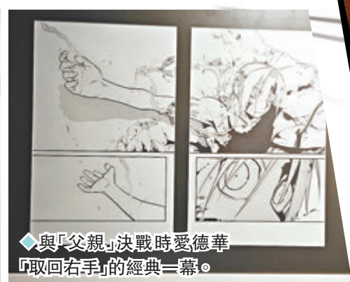
◆與「父親」決戰時愛德華「取回右手」的經典一幕。