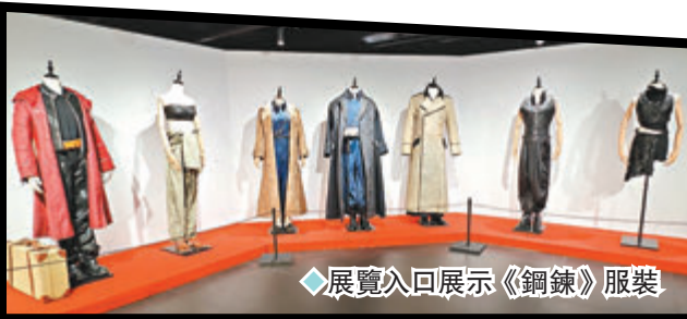
◆展覽入口展示《鋼鍊》服裝