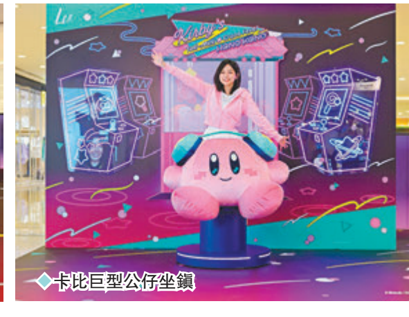
◆卡比巨型公仔坐鎮