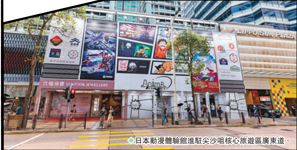
◆日本動漫體驗館進駐尖沙咀核心旅遊區廣東道。