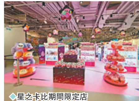
◆星之卡比期間限定店

同場更有Nintendo Switch的「星之卡比」系列遊戲體驗，讓你與朋友一起展開冒險之旅！參加見面會或完成遊戲後，還可以獲得星之卡比的主題紙帽以