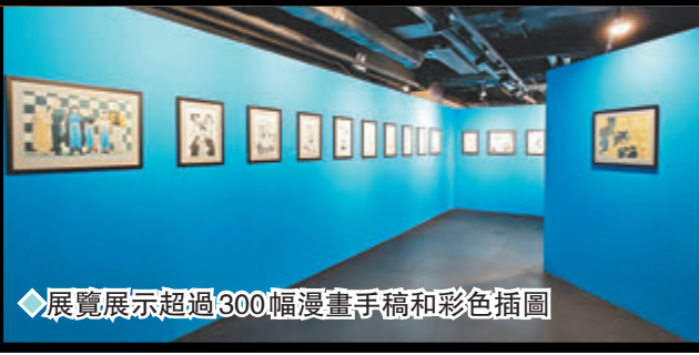
◆展覽展示超過300幅漫畫手稿和彩色插圖

萬眾期待的「鋼之鍊金術師展·香港站」由即日起至6月11日，於anima Tokyo 1樓「Incubase Arena」正式開幕，展覽區面積約為1萬呎，展出超過300件展品及收藏品，當中更不乏稀有收藏品，包括《鋼之鍊金術師2022》真人電影中使用的服裝道具。展覽以七個獨特的展區展示荒川弘老師傳奇漫畫的全貌，展示超過300幅漫畫手稿和彩色插圖、一比一模型、引人入勝的動畫多媒體裝置，以及美輪美奐的服裝和道具，都將觀眾帶入一個深刻體驗，彷彿置身於漫畫中的冒險之旅。荒川弘老師更為這次首次海外展覽特備了一幅畫，在展覽館中展示，以表達對觀眾們的感激之情。