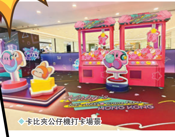
◆卡比夾公仔機打卡場景

作留念！卡比和瓦豆魯迪這麼可愛，大家怎麼可以不把它們帶回家？粉絲可到星之卡比期間限定店，入手星之卡比系列的公仔、小袋子、保溫杯、文件夾、襟章以及環保袋等精品，沉醉在星之卡比的宇宙之中！