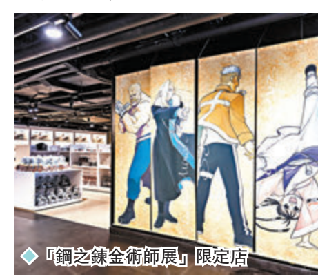
◆「鋼之鍊金術師展」限定店

而且，香港站展覽更獨創四大打卡景點，讓一眾粉絲與一幕幕經典場面拍照留念。四大景點分別是重演艾力克兄弟鍊成實驗的「鍊金術師研究室」、令千千萬萬讀者揪心的「合成獸」紙板、與「父親」決戰時愛德華「取回右手」的經典一幕，以及大家都記憶猶新的「真理之門」。展覽內還特設有趣的蓋章活動，參觀者可領取活動手冊，集齊六個印章後，即可獲得《鋼之鍊金術師》的貼紙和成為亞美斯多利軍的榮譽證書。展覽內亦設有專門的商品區，出售《鋼之鍊金術師》周邊產品及香港區專屬的全球首發獨家周邊產品，結合創新設計與獨特風格，粉絲們不能錯過！