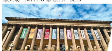
◆聖喬治大廳掛上「利物浦愛 Taylor」的條幅迎接巡演。

英國文化藝術領域工會「藝術營銷協會」分析，體驗文化旅遊的遊客最大特徵，便是對融入目的地國家文化的渴望，「人們需要的參與感和體驗感，不再局限於目的地或是地標本身，如果英國從業者能提供高價值的體驗服務，或會贏得更多遊客關注。」