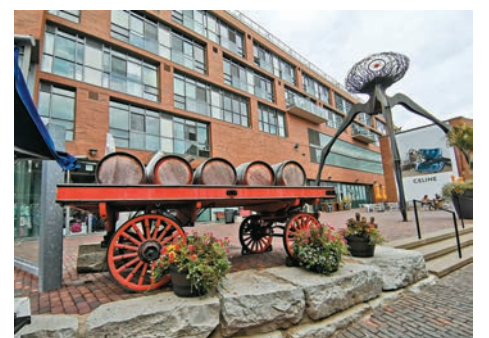
◆古釀酒廠區前身是釀酒廠，現在發展成為文藝園區。