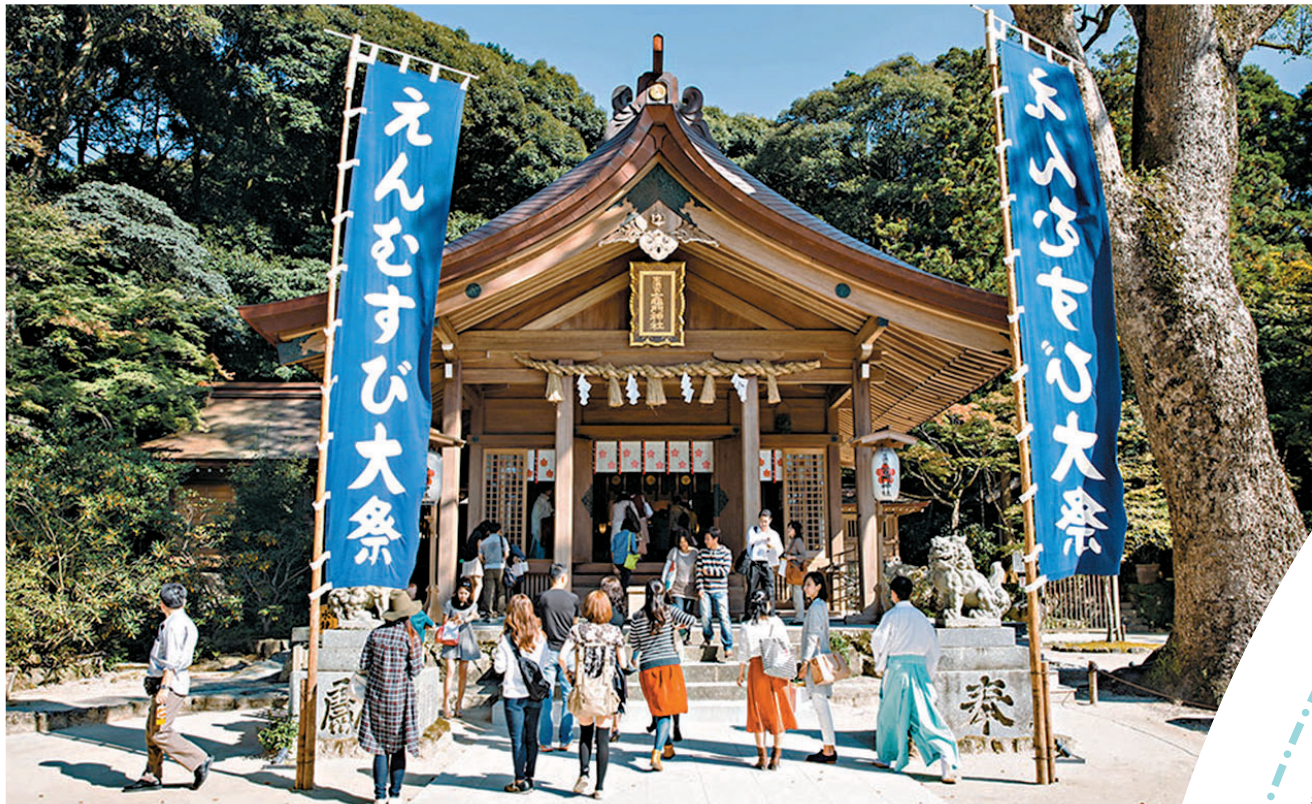
◆福岡竈門神社因與《鬼滅之刃》中主角姓氏「竈門」相同，吸引大量動漫迷前來。