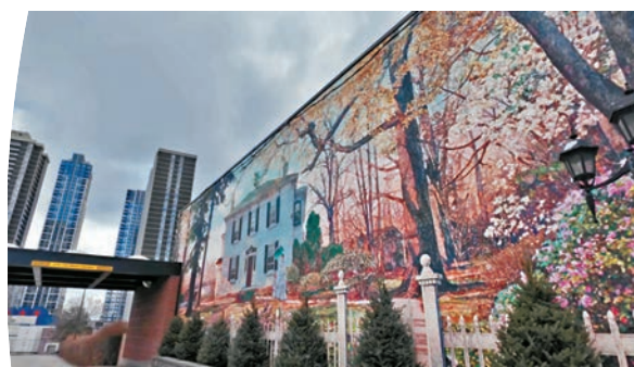
◆多倫多很多街道滿布壁畫，充滿豐富文化色彩。