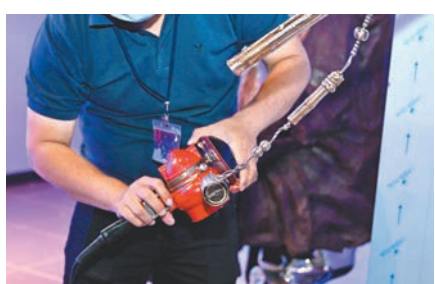
◆策展團隊正在修整展品。

而當時，鄧民亮完全沒有想到在未來真的會成就一個金庸人物主題的任哲雕塑展。時隔幾年，他轉來香港文化博物館工作，由去年館方開始構思一個金庸相關展覽，得知金庸家人已授權一位雕塑家創作金庸筆下人物的雕像，那位雕塑家正是任哲。鄧民亮才欣喜地發現，自己與金庸先生、雕塑家任哲的緣分，是「冥冥中有安排」。