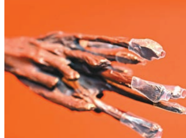
▲運輸過程中對易碎位進行的特殊保護。