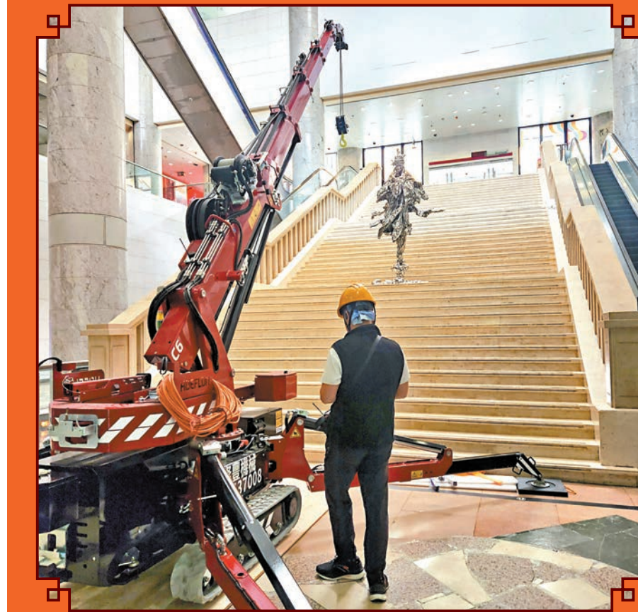
◆需用到起重機將展品放上大樓梯。