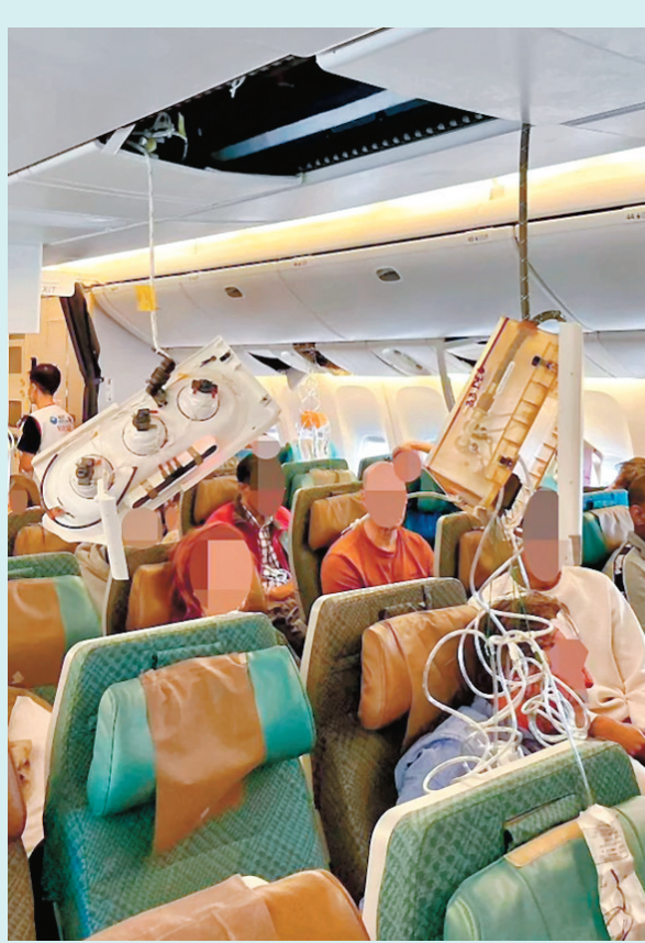
行李散滿整個機艙，許多氧氣罩掉下。網上圖片

路透社報道，根據美國國家運輸安全委員會(NTSB)於2021年進行的研究顯示，氣流引致的航空意外，是航空業最普遍發生的安全事故，在2009年至2018年間佔整體事故逾三分之一，大部分均引致有人受傷。這亦是波音飛機涉及的最新一宗事件，今年1月，阿拉斯加航空公司一架波音737 MAX飛機在飛行途中艙門掉落；2018及2019年時，波音737 MAX也曾發生致命墜機事故。