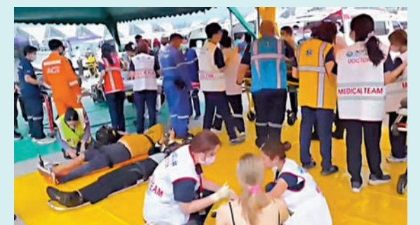
多名傷者躺在地上等待治理。