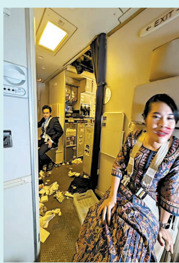
機組人員受傷流血。