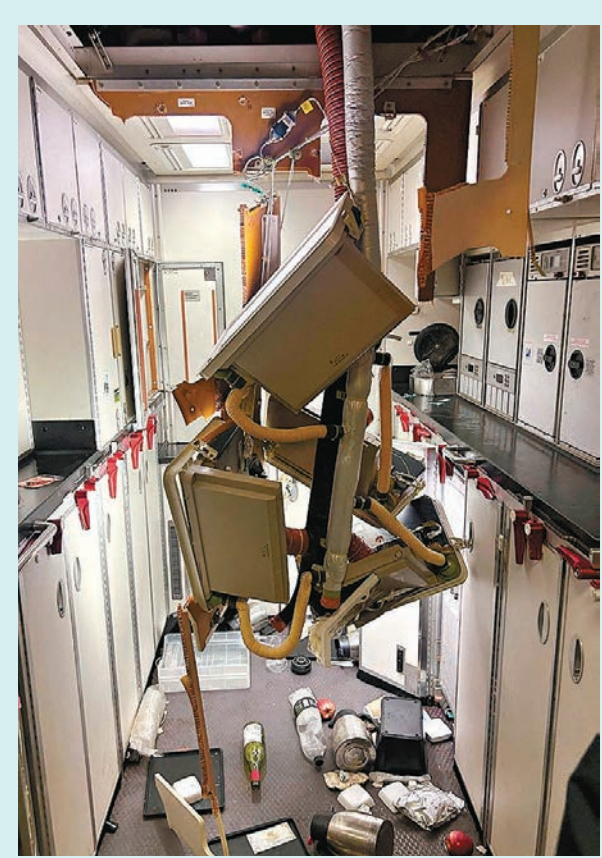
客機組件從天花板掉下來。