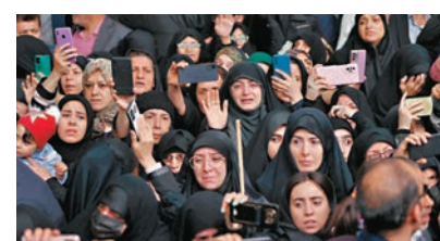
◆ 伊朗民眾在遺體告別儀式哭別萊希。

場聚集，跟隨載着萊希及其他遇難隨行人員靈柩的車輛，沿途揮舞國旗及舉起萊希的畫像，部分人情緒激動。根據安排，萊希遺體周二晚移送首都德黑蘭，周三上午由最高領袖哈梅內伊主持悼念儀式，萊希遺體其後會運往家鄉馬什哈德，周四舉行葬禮後下葬。伊朗政府、國會和司法領導人周一召開會議後確定，第14屆伊朗總統選舉將於6月28日舉行。