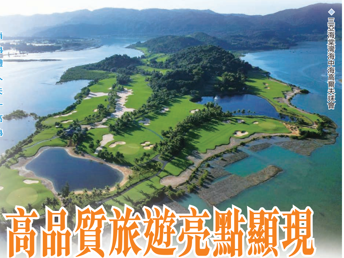
◆ 三亞海棠灣中海高爾夫球會

隨著內地旅遊市場的不斷發展和消費者需求的多樣化，高爾夫旅遊作為一種集休閒、健身與文化體驗於一體的旅遊方式，正逐漸受到越來越多人的青睞。位於海南三亞的各大高爾夫球場憑藉其得天獨厚的自然環境和一流的設施服務，吸引了大量國內外高爾夫愛好者和旅遊者前來體驗，成為三亞旅遊市場的一大亮點。