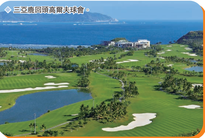
◆ 三亞鹿回頭高爾夫球會。

隨著內地旅遊市場的不斷發展和消費者需求的多樣化，高爾夫旅遊作為一種集休閒、健身與文化體驗於一體的旅遊方式，正逐漸受到越來越多人的青睞。位於海南三亞的各大高爾夫球場憑藉其得天獨厚的自然環境和一流的設施服務，吸引了大量國內外高爾夫愛好者和旅遊者前來體驗，成為三亞旅遊市場的一大亮點。