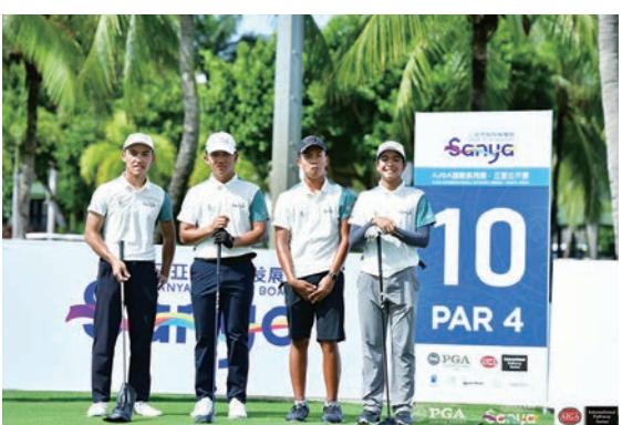
◆ 參與海南首屆AJGA國際系列賽——三亞公開賽的青少年球員合照。

近日，三亞的多家高爾夫球場迎來了大批香港遊客。他們或揮桿擊球，或漫步綠茵，享受着高爾夫運動帶來的樂趣。這些遊客們，既有資深的高爾夫愛好者，也有從未玩過這項運動的初學者。他們紛紛表示，三亞的高爾夫球場環境優美，設施完善，是體驗高爾夫運動的絕佳選擇。當中，創建於1997