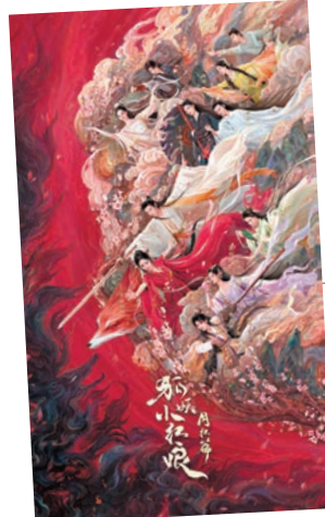
◆半個古偶團圍演繹東方美學。

據了解,整部劇集巧妙地將非遺文化融入劇集創作中,例如:塗山紅紅的外袍運用了吳羅織造技藝,狐狸面具採用了花絲鑲嵌、配飾上加入火紅九尾狐絨花、服裝上加入蘇繡等非遺工藝,呈現出獨特的文化風格,達到既精緻又美觀的服飾樣式,高標準高追求地營造出東方美學的視覺盛宴。