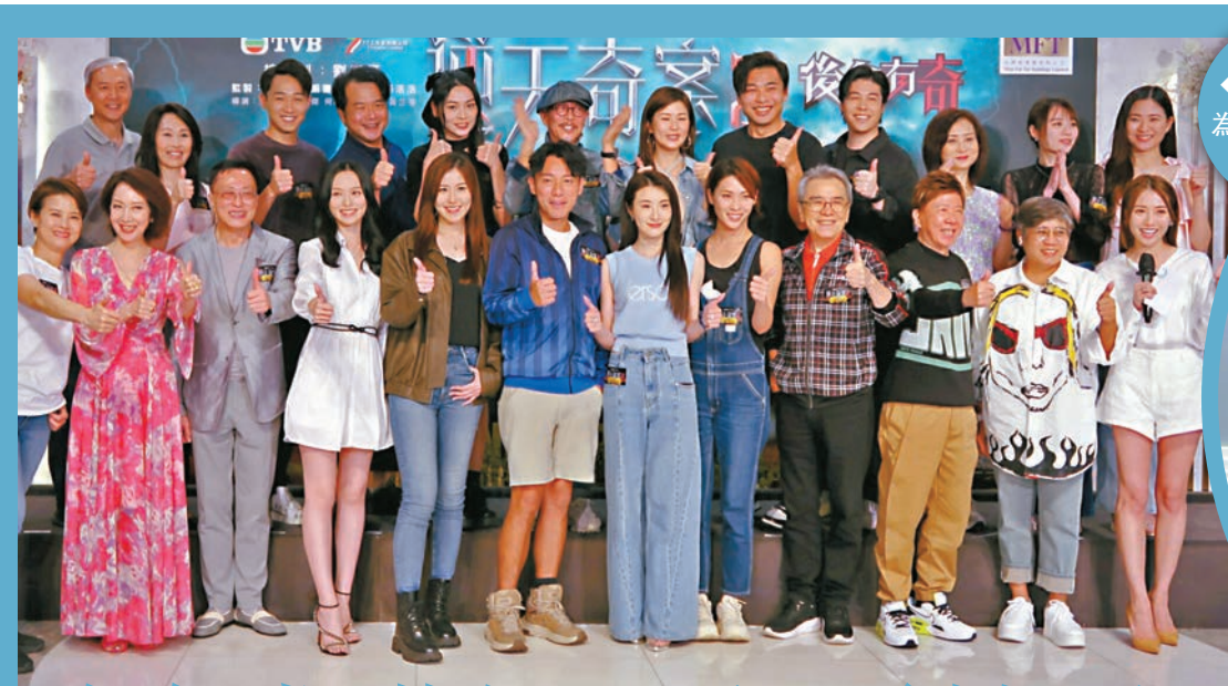
◆一眾主創為劇集好收視點讚。