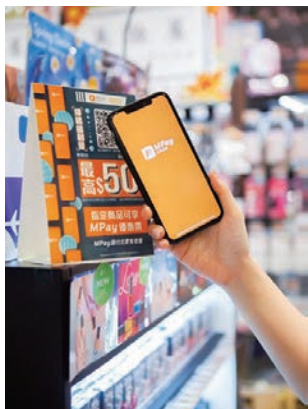
◆ MPay 在推動澳門智慧城市的建設中起重要作用。

可以說，澳門通正配合澳門特區政府「旅遊+」跨界融合策略，實現本地電子商務產業和旅遊業的互動發展，幫助本地企業發現新的行銷機會，助力特區政府帶動社區消費，全面提升社會經濟效益。