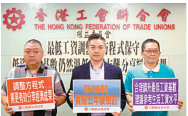
◆工聯會就最低工資調整新機制發表意見。

權委認為，一系列數據反映勞動付出與收入不成正比，辛勞付出得不到合理回報，造成在職貧窮的問題。權委建議先將方程式中「共享經濟繁榮」因素的計算比率調升，讓經濟成果更有效分享給底層工人，並參考生活工資水平，合理地調升最低工資水平的基數，以及在新機制實施5年後檢討加入生活工資作為參考指標。