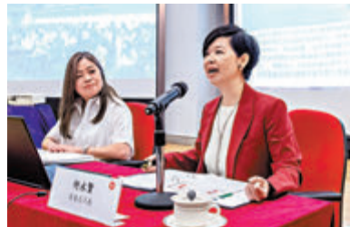
◆何永賢(右)和羅淑佩

香港文匯報訊（記者 藍松山）房屋局局長何永賢昨日在社交平台表示，自己在本周二到房委會總部，與房屋署長羅淑佩一起主持「學習全國兩會精神」座談會，向房委會員工講述當中的要點及對香港未來發展的意義，並引導他們把這種精神融會貫通，應用於每天的工作之中。