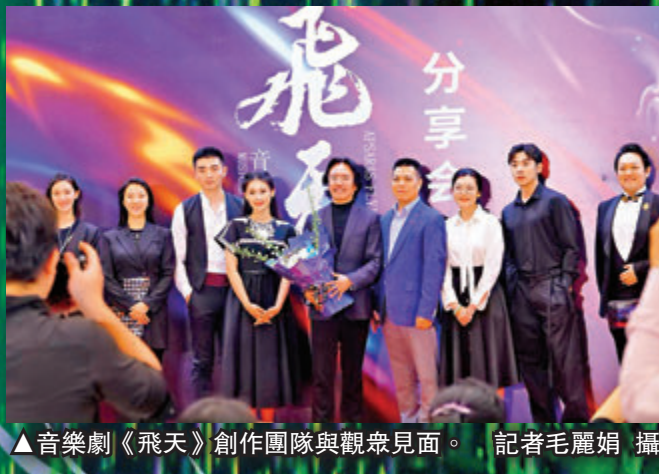
▲音樂劇《飛天》創作團隊與觀眾見面。