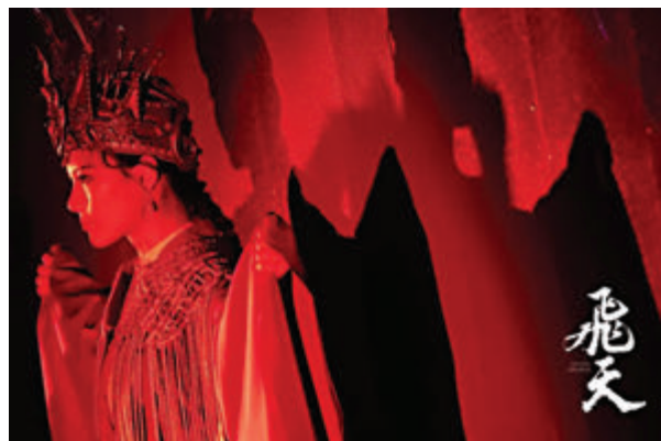
▲音樂劇《飛天》這個周末亮相深圳文博會藝術季。