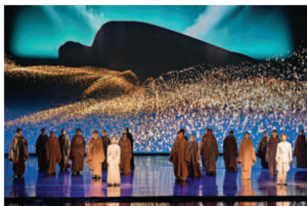
▲音樂劇《飛天》帶來美妙視聽感覺。