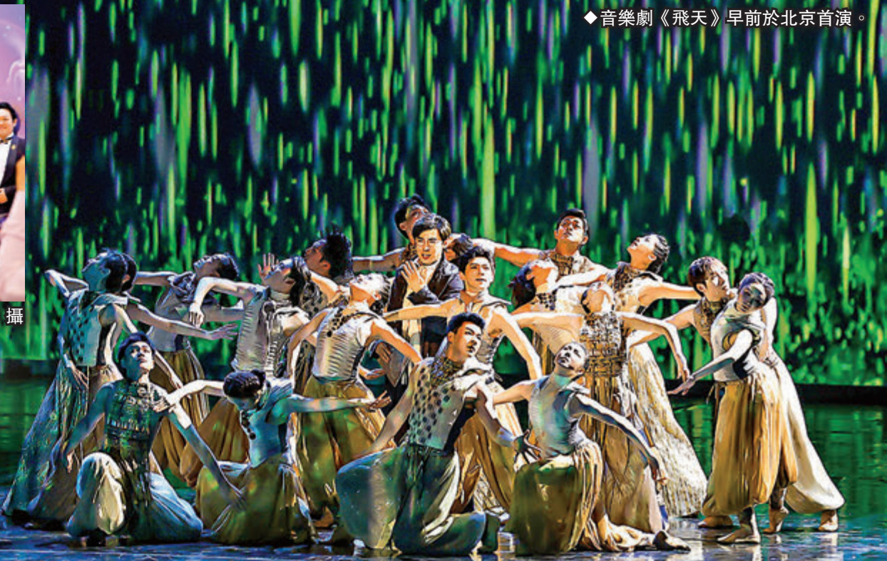
◆音樂劇《飛天》早前於北京首演。