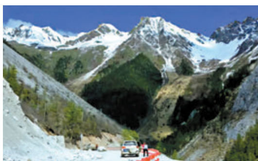
◆ 自駕穿越丙察察。

但是那時丙察察路況極差，路途艱險。幾乎全程穿行在山嶺、懸崖、江河和峽谷之中，270多公里左右的路程，一半以上的路是砂石路面的山地重丘鄉土公路，路上盡是俗稱的「炮彈坑」和「搓衣板」，對車和人都是極大的挑戰。一部分主體路基是曾經的茶馬古道的主要通道，以路面寬約4.5米的簡易公路為主。尤其是秋那桶到察瓦龍的87公里路，是丙察察線爛路中最爛的路段，這段路不是路面坑窪，就是飛沙走石，再不然就是傍山險路、水浸路段、亂石路段。這段路上最為著名的死亡路段是大流沙和老虎口。更糟糕的是，由於變化無常的氣象條件，這條路全年沒有一個完整、明確的通行周期，在路上的人，通常只能依靠在落腳的旅館或營地打聽到的有關路況的各種小道消息，來判斷第二天的行程。由於陳坤的旅館常年熱心及時給驢友們提供丙察察