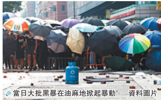
◆當日大批黑暴在油麻地掀起暴動。

香港文匯報訊（記者 葛婷）2019年11月，香港一批黑暴分子在油麻地掀起暴動，圍攻警方防線，企圖「營救」被包圍在理工大學內的暴徒。當時，香港警方一舉拘捕213人並控以暴動罪，分為17案審訊。其中一案的4名被告不認罪受審，其中兩人辯稱到油麻地光顧色情場所，一人辯稱食放題和足部按摩。區域法院暫委法官梁嘉琪昨日裁決，表示不接納該3名被告供稱的出門目的及到場原因，認為3人知悉現場有暴動正在