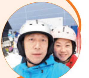
夫婦一起做運動鍛煉身體。

曾駐守單位：元朗分區軍裝巡邏小隊、警察機動部隊、元朗分區鄉村巡邏隊、元朗區特別職務隊、青山分區特遣隊、新界北總區失蹤人口調查組、屯門分區特遣隊、新界北衝鋒隊、保安部、青山分區行動及支援小隊、屯門區特別職務隊、天水圍分區深圳灣口岸、打鼓嶺分區軍裝巡邏小隊、警察公共關係科八鄉少訊中心青少年發展組、打鼓嶺分區值日官、羅湖口岸值日官、沙頭角分區值日官