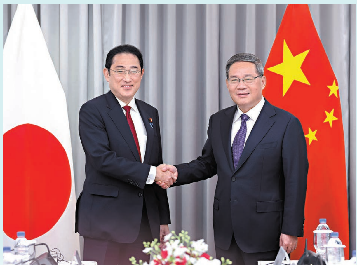
◆昨晚，國務院總理李強在首爾出席第九次中日韓領導人會議期間會見日本首相岸田文雄。新華社

香港文匯報訊 綜合新華社報道，5月26日，國務院總理李強在首爾出席第九次中日韓領導人會議期間，分別會見韓國總統尹錫悅、日本首相岸田文雄。李強會見尹錫悅時指出，中方願同韓方加強多邊領域溝通協調，共促地區和世界和平發展。會見岸田文雄時，李強強調，歷史、台灣問題是事關中日關係政治基礎的重大原則問題，也是基本的信義問題。台灣問題是中國核心利益中的核心，也是一條紅線。希望日方重信守諾，為兩國關係不斷發展營造積極氛圍。