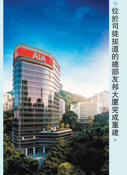
位於司徒拔道的總部友邦大廈完成重建。

資料來源：據彭博2023年10月《亞洲金融雙城記：銀行家堅守香港 富人湧向新加坡》報道整理