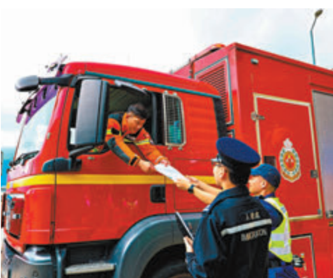
◆ 演練模擬接獲廣東省消防救援總隊通知，港派員支援。

香港文匯報訊（記者 蕭景源）為加強粵港澳大灣區的應急救援能力，應對影響三地的災難事故或自然災害等突發事件，保安局人員聯同消防處災難應變救援隊昨日前往江門市特勤消防站，進行48小時的粵港澳三地應急救援聯合演練，落實《粵港澳大灣區應急救援行動方案》中的應急動員協調機制作準備，促進三地應急管理工作水平的整體提升，實現應急救援資源的有效利用和合理共享。