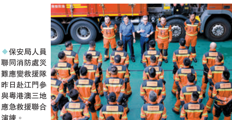
◆ 保安局人員聯同消防處災難應變救援隊昨日赴江門參與粵港澳三地應急救援聯合演練。