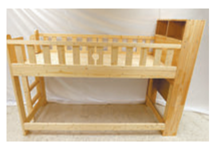
◆ 海關提醒市民留意一款不安全兒童高架床。

香港文匯報訊（記者 蕭景源）香港海關昨日提醒市民，留意一款不安全的兒童高架床，使用者或有潛在夾傷風險。海關早前接獲舉報，指市面上有一款懷疑不安全的兒童高架床出售，人員隨即展開調查，從一間網上零售商試購該款兒童高架床作安全測試，結果顯示床的部分圍欄的縫隙闊度未能符合相關安全標準要求，涉嫌違反《消費品安全條例》的一般安全規定。案件仍在調查中，海關已向有關的零售商兼進口商發出禁制通知書，禁止他們繼續出售該款兒童高架床。