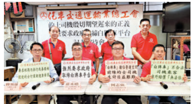
◆ 工會指的士「放蛇」行動警方僅列投訴處理，司機不滿當局「不作為」。

香港文匯報訊（記者 文森）近期有的士司機以「放蛇」方式欲打擊「白牌車」，特區政府以業界因無專業訓練和相關法律規限為由，勸喻司機向執法部門舉報和免誤墮法網。汽車交通運輸業總工會昨日舉行記者會表示，工會亦不鼓勵同業私下「放蛇」，惟政府的呼籲亦未能平息的士司機怒火，工會亦接獲不少會員投訴，對「白牌車」搶佔營運空間表達強烈不滿。工會強烈建議政府全面取締「白牌車」營運平台。