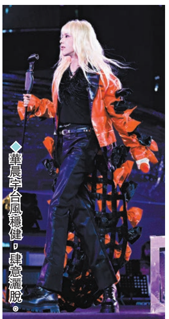
◆華晨宇台風穩健,肆意灑脫。