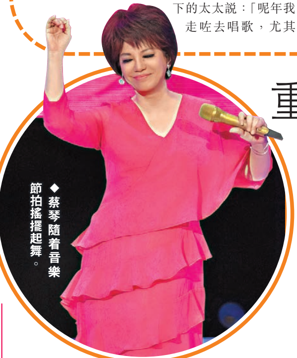
◆蔡琴隨着音樂節拍搖擺起舞。