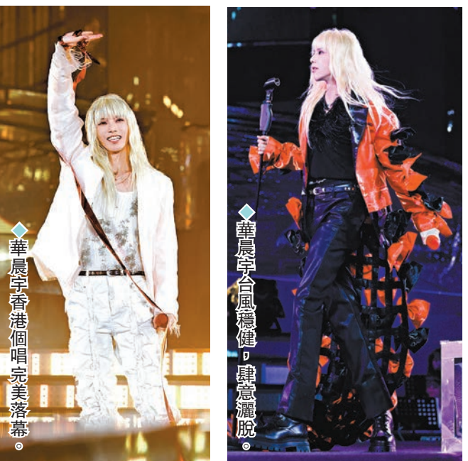
◆華晨宇香港個唱完美落幕。

粉絲們紛紛表示:「意猶未盡」「戒斷反映強烈」「很難忘的三天,香港真的超級棒!」「那個繁榮開放的香港又回來了!」在霓虹都市中屬於「火星人」的狂歡雖已落幕,雨會停,天會晴,期待在四時流轉中與華晨宇的再次相逢。