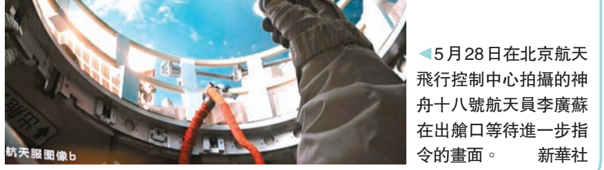
5月28日在北京航天飛行控制中心拍攝的神舟十八號航天員李廣蘇在出艙口等待進一步指令的畫面。