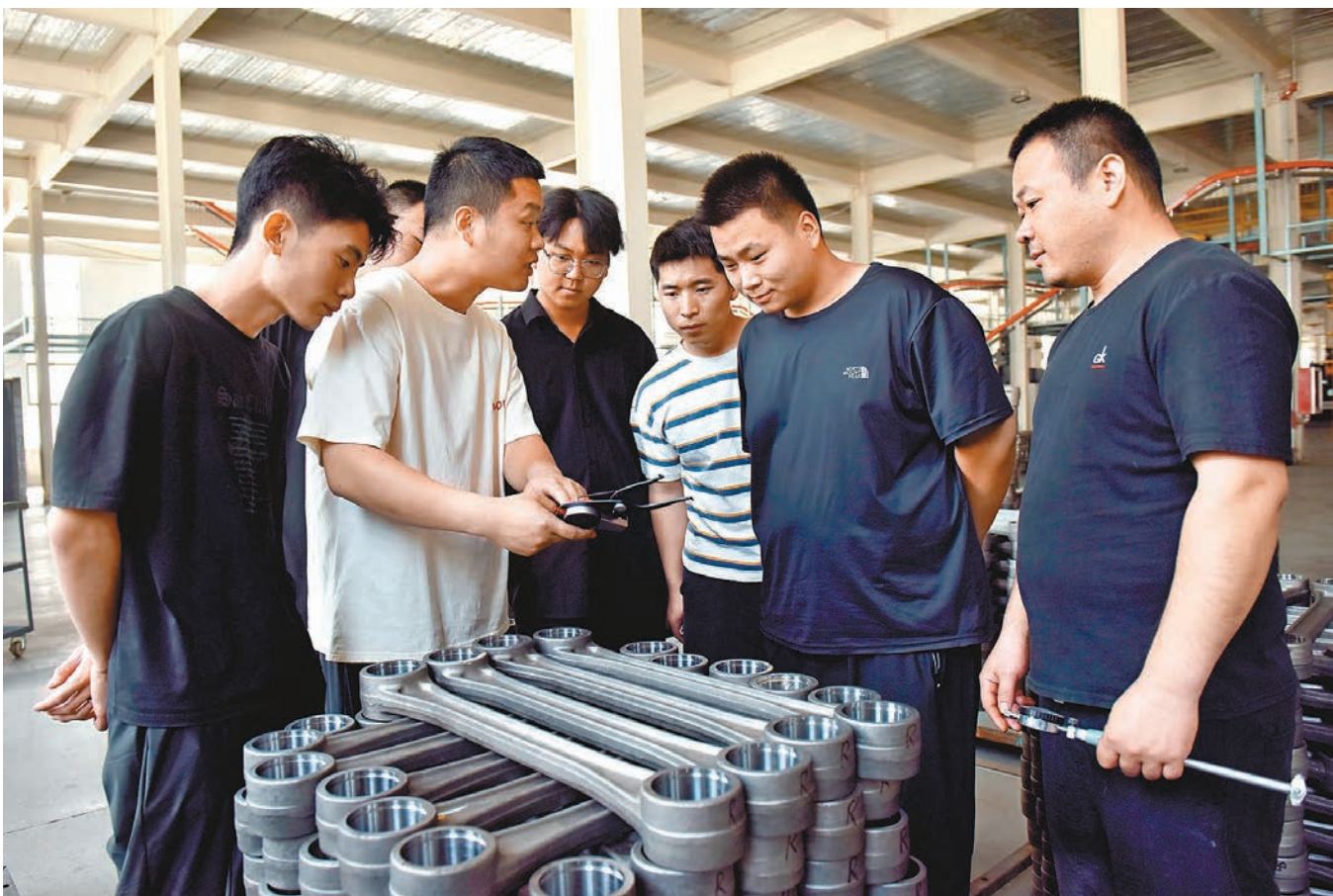
5月28日，在河北威縣務務品牌建設單位邢台威力汽車零部件有限公司，教師為學員講解測量工具使用方法。

習近平在聽取講解和討論後發表了重要講話。他指出，就業是最基本的民生，事關人民群眾切身利益，事關經濟社會健康發展，事關國家長治久安。黨的十八大以來，黨中央堅持把就業工作擺在治國理政的突出位置，強化就業優先政策，健全就業促進機制，有效應對各種壓力挑戰，城鎮新增就業年均1,300萬人，為民生改善和經濟發展提供了重要支撐。在實踐中不斷深化對新時代就業工作規律的認識，積累了許多經驗。主要包括：堅持把就業作為民生之本；堅持實施就業優先戰略；堅持依靠發展促進就業；堅持擴大就業容量和提升就業質量相結合；堅持突出抓好重點群體就業；堅持創業帶動就業；堅持營造公平就業環境；堅持構建和諧勞動