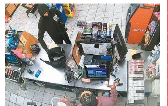
◆美國多地治安不見改善，許多零售業員工考慮辭職。網上圖片

的勞動力外流，73%受訪者承認他們考慮辭職，64%受訪者因就職商舖遭到暴力犯罪，會考慮起訴僱主。Theatro行政主任托德強調，該調查體現美國零售業員工處於不安全的工作環境，零售商應優先考慮加強培訓，與員工溝通，磋商各項提升保安質素的措施。