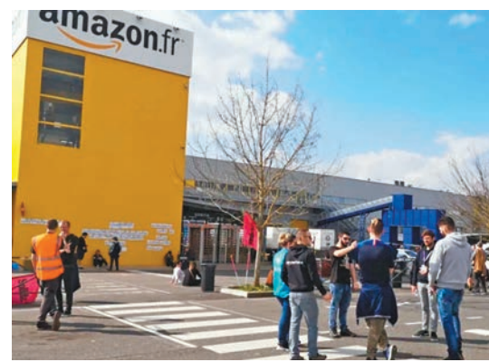
◆法國亞馬遜被指過度監控員工，被罰款2.7億元。

CNIL批評，亞馬遜的追蹤行為屬過度侵入，嚴重侵犯員工權益，把收集得的員工數據儲存31天之久亦過長。雖然亞馬遜辯稱調查結果「與事實不符」，但CNIL認定亞馬遜的監控系統屬違法，會繼續進行調查。