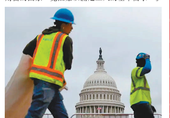
◆美國工人最低時薪是所有發達國家中最低。

依照國際人權法案，工人的薪酬應滿足基本生活標準，且根據通脹水平定期調整。報告直言，「令人尷尬的是，美國作為一個擁有如此多財富的國家，竟然難以滿足工人的基本需求。」